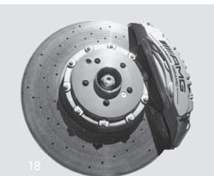
AMG Keramik Verbundbremsanlage