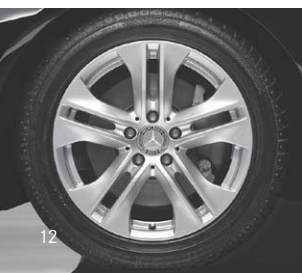
5-Doppelspeichen-Design (R 11)