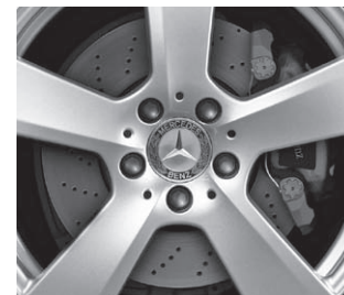
Bremsscheiben vorne gelocht