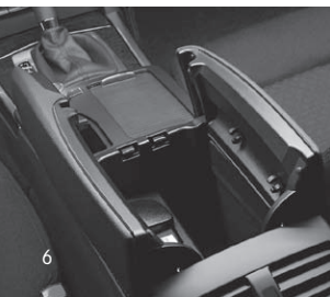
Ablagefach in Mittelkonsole