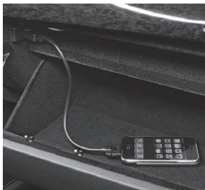
Media Interface 1)