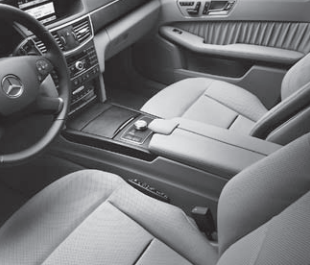
Polsterung Leder Nappa