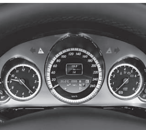
Kombiinstrument in silber