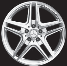
AMG 5-Doppelsp.-Design (791/795)