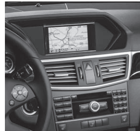
Audio 50 APS