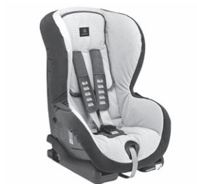
Kindersitz DUO plus