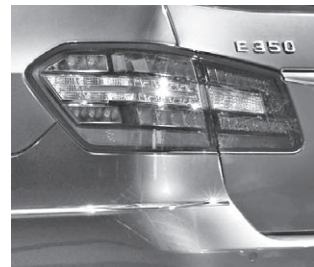
Heckleuchte in LED-Ausführung