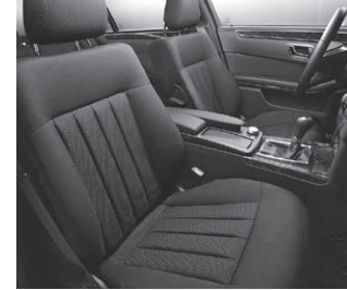
Polsterung Stoff Toulon

Kühlergrill mit 3 Lamellen schwarz lackiert