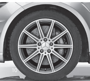
AMG Leichtmetallrad (796)