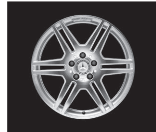
AMG Doppelsp.-Design (781/786)