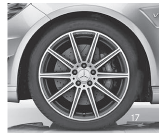
AMG Leichtmetallräder (796/797)