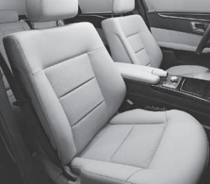
Polsterung Stoff Biarritz/ARTICO