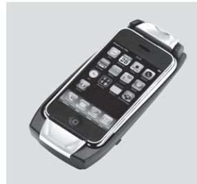
Aufnahmeschale für Apple iPhone