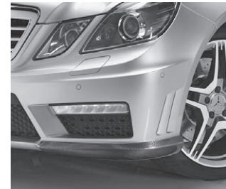
AMG Exterieur Carbon-Paket