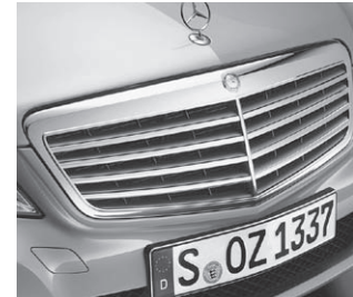
Kühlergrill silber lackiert