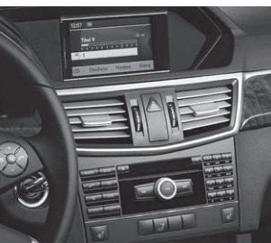
Radio Audio 20 CD