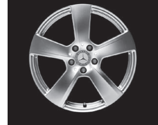
5-Speichen-Design (Code R32/R96)

Zweiflutige Abgasanlage mit eckigen, fest in den Stoßfänger integrierten Endrohrblenden in Edelstahl poliert