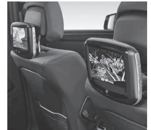
Fond Entertainment System Kit