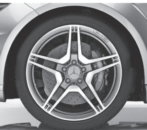
AMG Schmiererad (793)