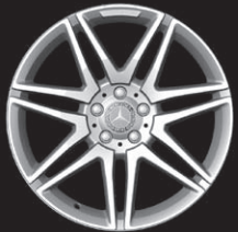
AMG 7-Doppelsp.-Design (770)