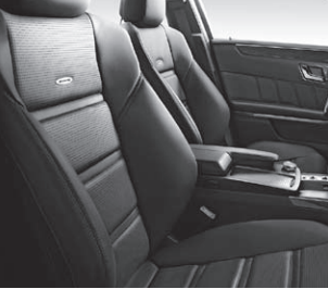
AMG Sportsitze vorne