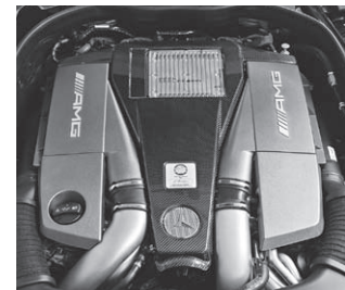
Motorabdeckung in Carbon