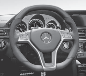
AMG Performance Lenkrad