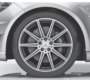
AMG Leichtmetallrad (797)