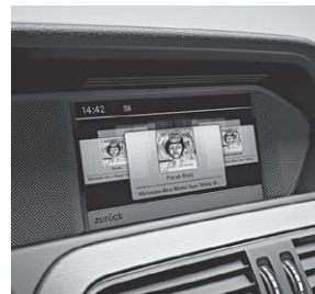
COMAND Online (527)