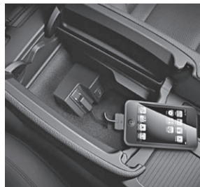
Media Interface (518)