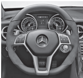
AMG Performance Lenkrad in Leder Nappa/Alcantara®