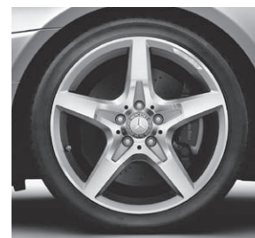
45,7 cm (18") AMG Leichtmetallrad im 5-Speichen-Design (782)