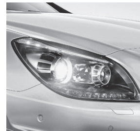
Scheinwerfer mit dunkler Einfassung