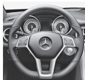
Multifunktions-Sportlenkrad mit Perforation und roter Ziernaht