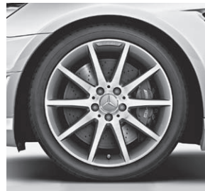
45,7 cm (18") AMG Leichtmetallrad im Vielspeichen-Design, Titangrau lackiert (796)