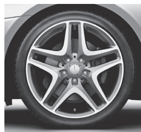
45,7 cm (18") Leichtmetallrad im 5-Doppelspeichen-Design (22R)