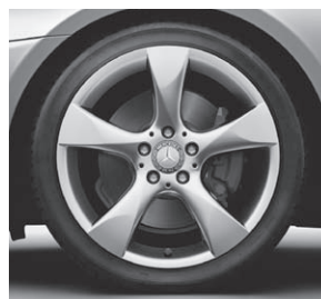
45,7 cm (18") Leichtmetallrad im 5-Speichen-Design (R32)