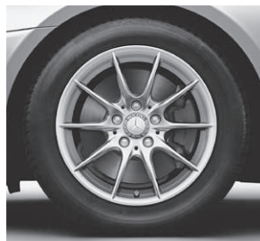
40,6 cm (16") Leichtmetallrad im 10-Speichen-Design (39R) (Serie SLK 200)