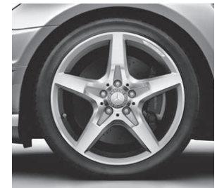
45,7 cm (18") AMG Leichtmetallrad im 5-Speichen-Design, glanzgedreht