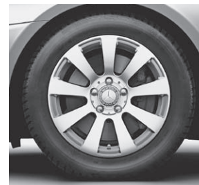
40,6 cm (16") Leichtmetallrad im 9-Speichen-Design (R12)