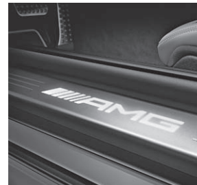
AMG Einstiegsschienen beleuchtet