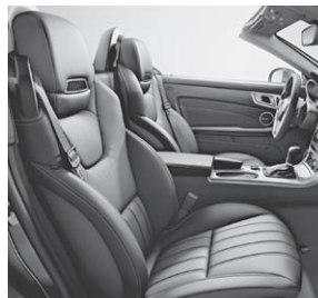
Sitze im spezifischen Längspfeifen-Design