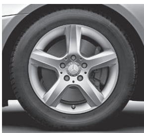
40,6 cm (16") Leichtmetallrad im 5-Speichen-Design (R19)