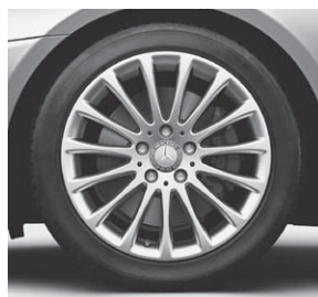
43,2 cm (17") Leichtmetallrad im Vielspeichen-Design (R81)