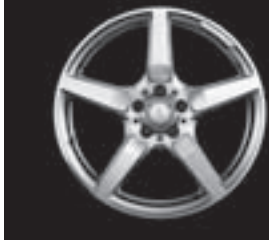
AMG 5-Speichen-Design (770)

8) in Verbindung mit Winterkomplettädern, Code 2R8 oder 2R9