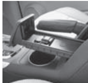
Komfort-Telefonie in Armauflage