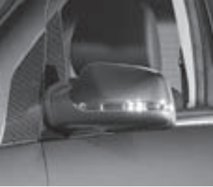
Außenspiegel in Wagenfarbe