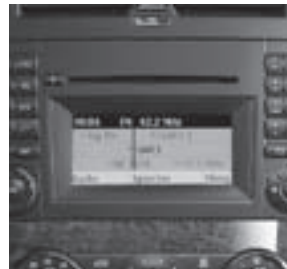
Audio 20 CD