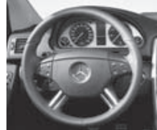
Lenkrad mit 2 Aluspangen