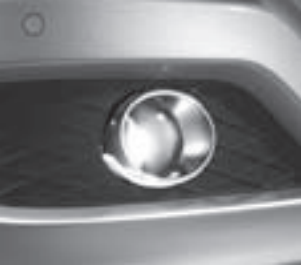
Nebelscheinwerfer mit Chrom