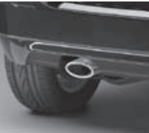
Auspuffendrohr oval in Edelsstahl