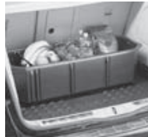
Kofferraumwanne, flach mit Staubox