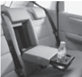
Armlehne im Fond klappbar