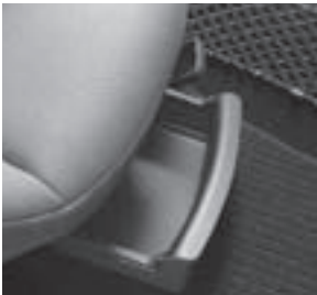
Ablagebox unter Beifahrersitz