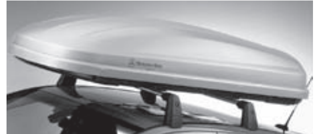
Grundträger New Alustyle, Mercedes-Benz Dachbox