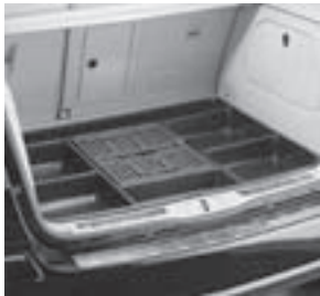
Ablageschale unter Ladeboden