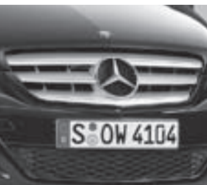
Kühlergrill in mattsilber