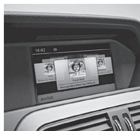
COMAND Online (527)