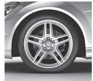
45,7 cm (18") AMG Leichtmetallräder im 5-Doppelspeichen-Design (786)