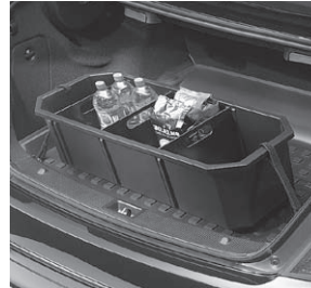
Kofferraumwanne, flach mit Staubox