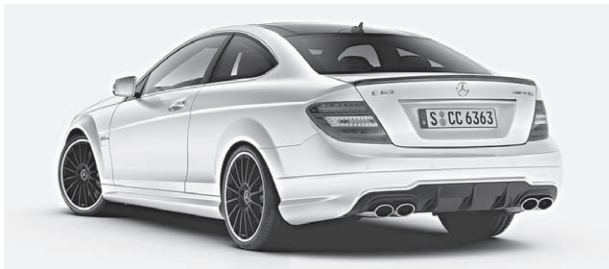
C 63 AMG mit AMG Performance Package