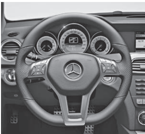
3-Speichen-Multifunktions-Sportlenkrad unten abgeflacht