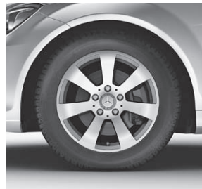
40,6 cm (16") Leichtmetallräder im 7-Speichen-Design (R20, R75)