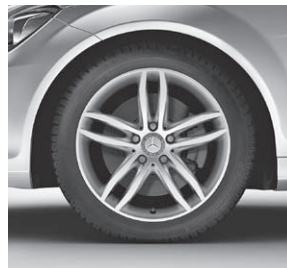
43,2 cm (17") Leichtmetallräder im 5-Speichen-Design (R95)