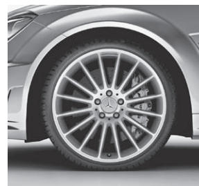
48,3 cm (19") AMG Leichtmetallrad Vielspeichen-Design Titangrau (788)