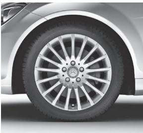
43,2 cm (17") Leichtmetallräder im Vielspeichen-Design (56R)