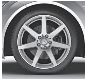
45,7 cm (18") AMG Leichtmetallrad im 7-Speichen-Design (782)