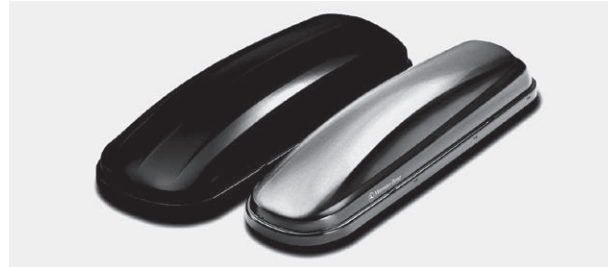
Mercedes-Benz Dachboxen 450 und 330