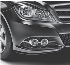
Abgedunkelte Scheinwerfer mit Tagfahrlicht und Nebelscheinwerfer