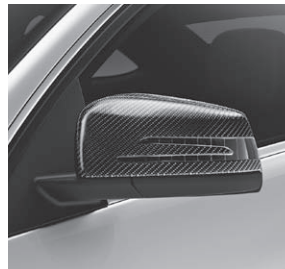
AMG Carbon-Paket Exterior