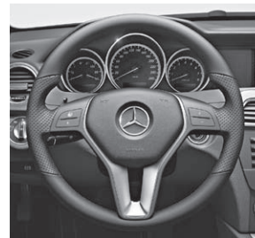
3-Speichen-Multifunktionslenkrad mit 4 Tasten