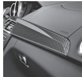
AMG Zierelemente Carbon