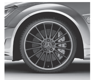
48,3 cm (19") AMG Leichtmetallrad Vielspeichen-D. Mattschwarz (797)