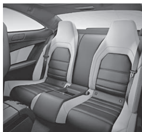
C 63 AMG Fond designo Leder zweifarbig in designo Leder porzellan/schwarz