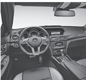
Erweiterte Ausstattung in designo Leder schwarz