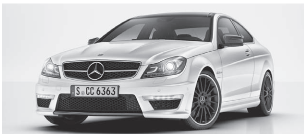
C 63 AMG mit AMG Carbon-Paket Exterior