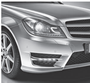
Intelligent Light System (622)