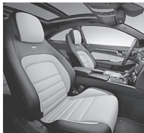
designo Leder zweifarbig in designo Leder porzellan/schwarz