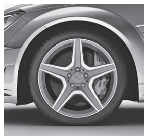
45,7 cm (18") AMG Leichtmetallrad im 5-Speichen-Design (790)