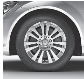
40,6 cm (16") Leichtmetallräder im 7-Doppelspeichen-Design (R27)