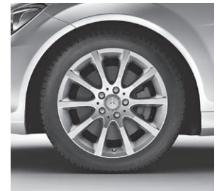
43,2 cm (17") Leichtmetallräder im 10-Speichen-Design (25R)