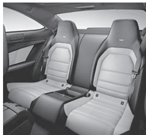
Fond designo Leder zweifarbig in designo Leder porzellan/schwarz