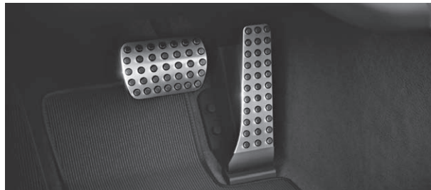
Sportpedalanlage aus gebürstetem Edelstahl mit Gumminoppen