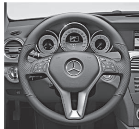
3-Speichen-Multifunktionslenkrad mit 12 Tasten (Code 442)