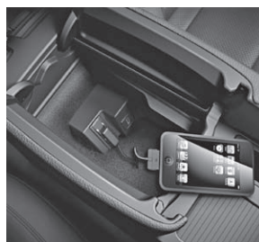
Media Interface (518)