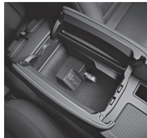
USB-Schnittstelle und AUX-IN Anschluss in der Mittelkonsole