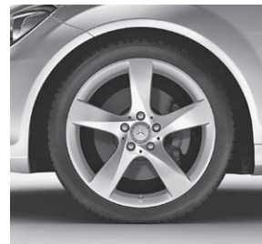
45,7 cm (18") Leichtmetallräder im 5-Speichen-Design (R36)