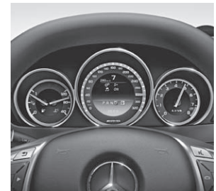
AMG Driver's Package