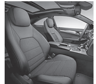
Coupé-Sitzanlage mit integrierten Kopfstützen