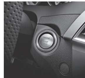
KEYLESS-GO (Code 889)