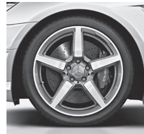
45,7 cm (18") AMG Leichtmetallrad im 5-Speichen-Design (790)