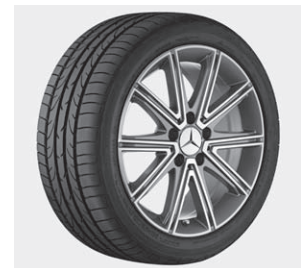
10-Speichen-Design, Palladiumsilber, glanzgedreht