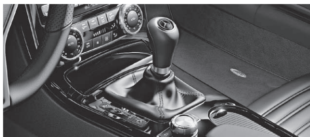
designo Zierelemente in Klavierlack schwarz