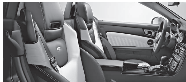
designo Leder Exklusiv zweifarbig