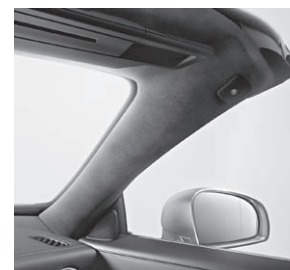
designo Scheibenrahmen Alcantara®