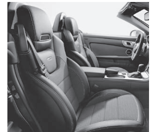
AMG Sportsitze mit Ledernachbildung ARTICO/Stoff