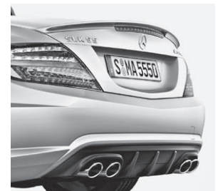
AMG Heckschürze, Abrisskante und Sport-Abgasanlage