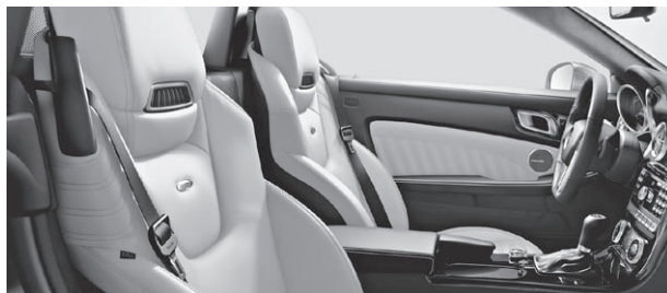
designo Leder Exklusiv einfarbig