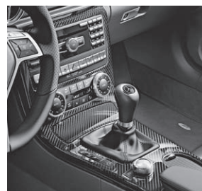
Zierelemente AMG Carbon