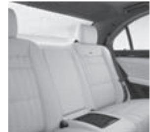
Fondsitzanlage designo Anilinleder Exklusiv einfarbig