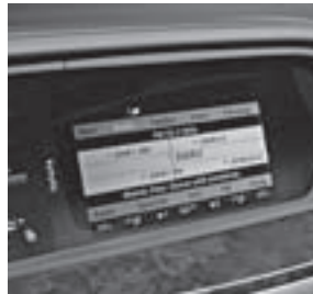
COMAND-Display mit SPLITVIEW