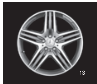
AMG Triple-Speichen-Design (797)