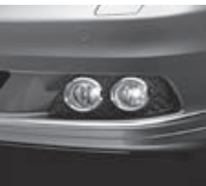
Tagfahrlicht und Nebelscheinwerfer