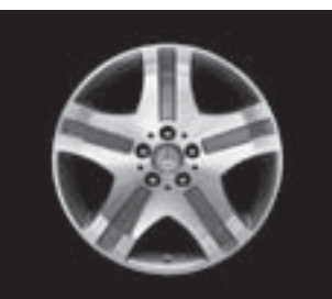
V 12 5-Speichen-Design (22R)