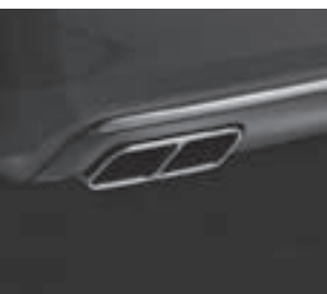
Verchromte Endrohre mit Steg