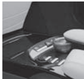
Zierelemente Klavierlack designo schwarz