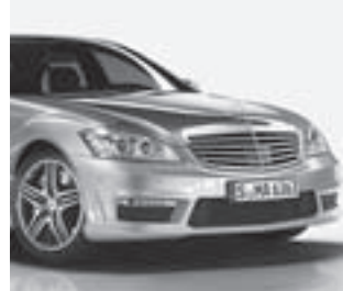
S 63 AMG Frontansicht