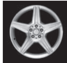
AMG Leichtmetallräder im 5-Speichen-Design (770/780)