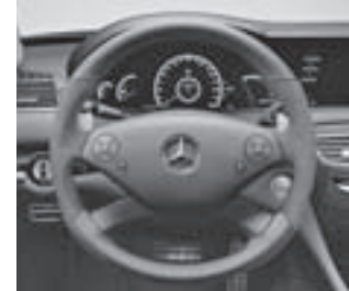
AMG Performance Lenkrad