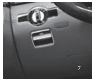
Kneebag für Fahrer