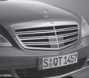
Kühlergrill mit Doppellamellen