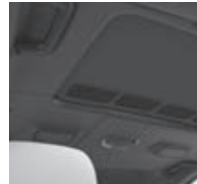
designo Innenhimmel Leder Nappa schwarz