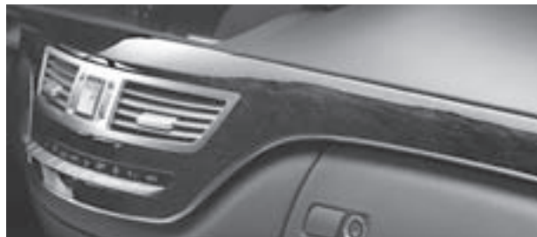
Zierelemente in Holz Esche schwarz glänzend