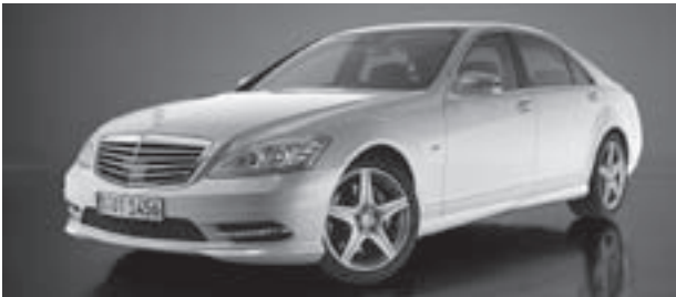
Frontschürze in AMG Styling