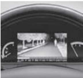
Nachtsicht-Assistent PLUS mit Personenerkennung