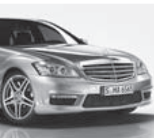
S 65 AMG Frontansicht