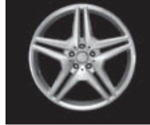
AMG Doppel-speichen-Design (771/775)