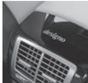
designo Logo in 18 Karat Gold