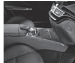
AMG Zierelemente Klavierlack schwarz/Carbon (siehe Seite 22)