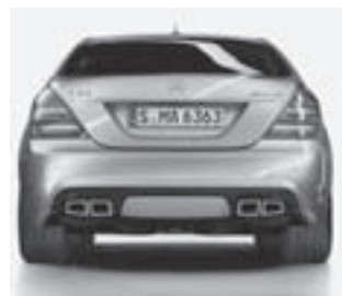
S 63 AMG Sportabgasanlage