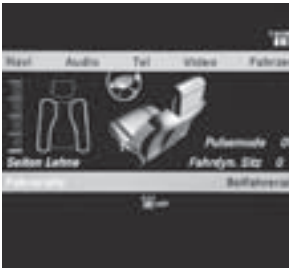
Aktiv-Multikontursitze vorne mit Massage- und Fahrdynamikfunktion