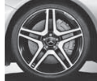
AMG Schmiederad (753)

* tagesaktuelle Konditionen unter www.mercedes-benz-bank.de (siehe Hinweis auf Seite 4)