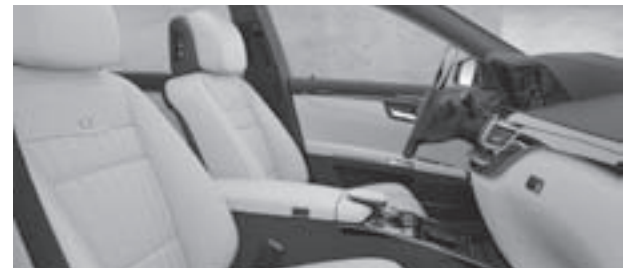
designo Anilinleder Exklusiv einfarbig