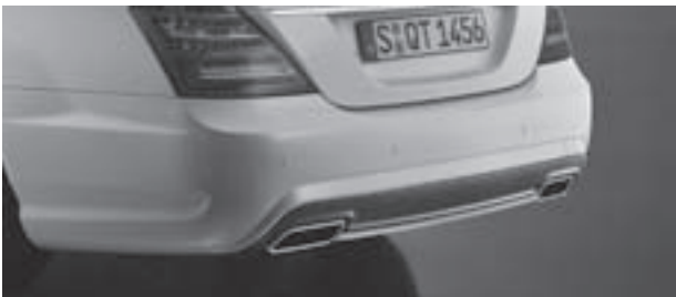
Heckschürze in AMG Styling