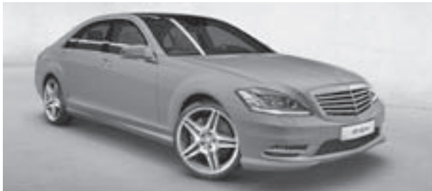
Lackierung designo magno platin