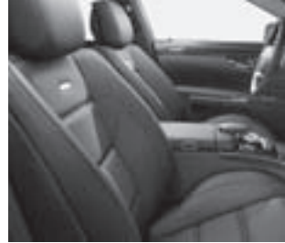
S 63 AMG Sportsitze

Instrumententafel und Türbeläge in ARTICO mit farblich abgesetzten Ziernähten