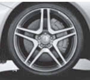
AMG Doppelsp.-Design (Code 783)