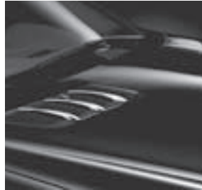
Finnenaufsätze für Motorhaube