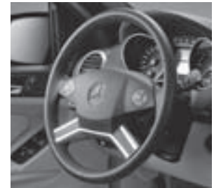
Multifunktionslenkrad in Leder-/Holzausführung