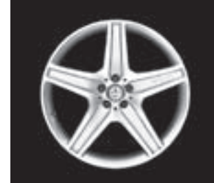
AMG 5-Speichen-Design (777)