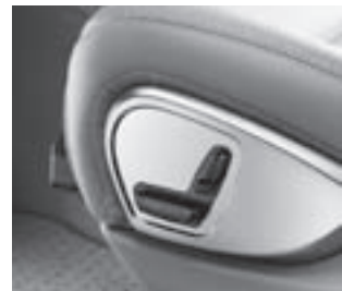
Vordersitze elektrisch verstellbar