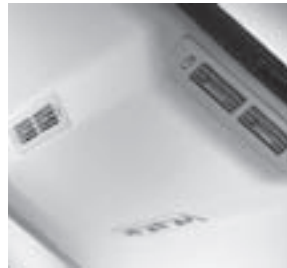
Klimaanlage im Fond