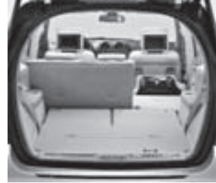
Fondsitzbank \frac{1}{3} : \frac{2}{3} klappbar

Sicherheitsgurte vorne 3-Punkt mit Gurtkraftbegrenzer und Gurtschloßstraffer mit PRE-SAFE®-Positionsfunktion; Sicherheitsgurte (2. Sitzreihe) 3-Punkt mit integriertem Gurtstraffer und Gurtkraftbegrenzer auf den äußeren Sitzen; mechanische Gurthöhenverstellung vorne