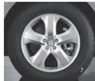
5-Speichen-Design (Code 21R)