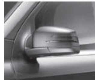
Außenspiegel mit Blinkleuchte