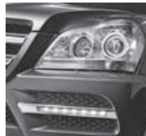
Intelligent Light System mit Bi-Xenon-Scheinwerfer