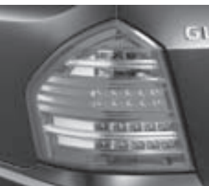
Heckleuchten mit LED-Technik