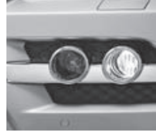
Tagfahrlicht mit Umrandung

Zierteile Birke hell mit Chromapplikationen