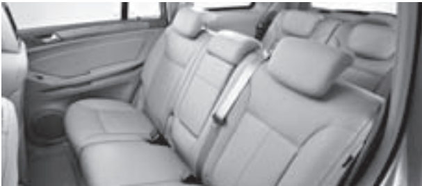
Polsterung Leder Nappa