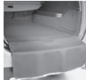
Wendematte mit Ladekantenschutz