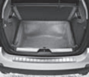
Staufach unter Laderaum