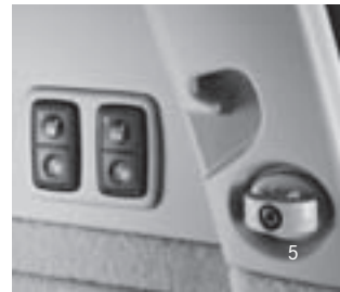
3. Sitzreihe elektrisch klappbar