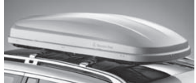
Crossbar in Chromoptik, Mercedes-Benz Dachbox