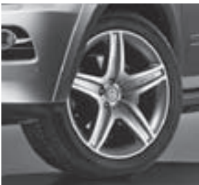
AMG 5-Speichen-Design (Code 777) mit Kotflügelverbreiterung