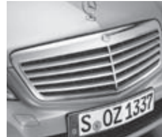
Kühlergrill silber lackiert