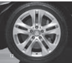
5-Doppelspeichen-Design (R 11)