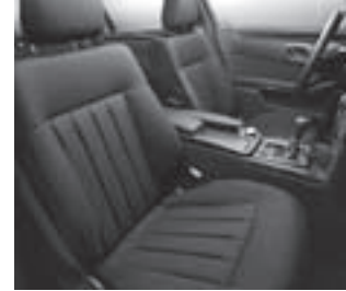
Polsterung Stoff Toulon

Nebelscheinwerfer und Tagfahrleuchten mit Chromringen