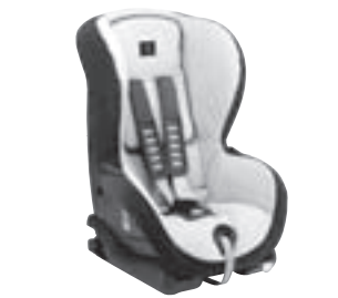
Kindersitz DUO plus