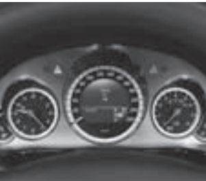
Kombiinstrument in silber