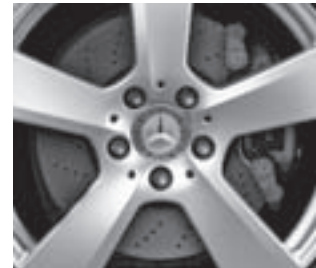
Bremsscheiben vorne gelocht