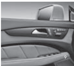
Zierelemente AMG Carbon