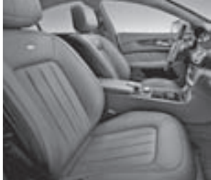
designo Polsterung Leder