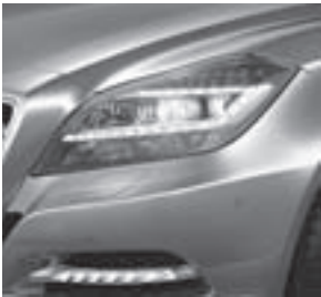
LED High Performance-Scheinwerfer und LED-Tagfahrleuchten