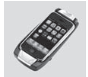
Aufnahmeschale für Apple iPhone