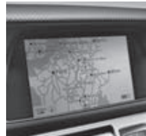
COMAND APS Display