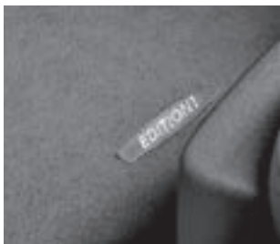
Fußmatten mit Edition 1 Schriftzug