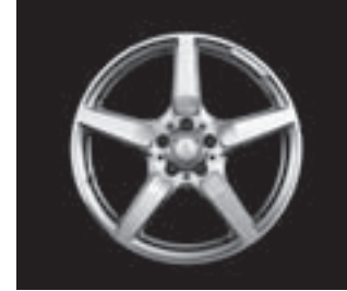
AMG 5-Speichen-Design (770)