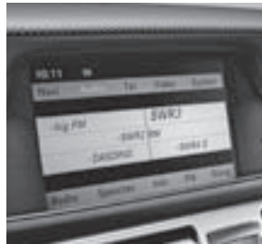
Audio 50 APS