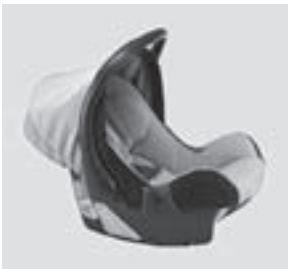
Kindersitz Baby Safe plus