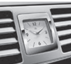
Instrumententafel mit Analoguhr