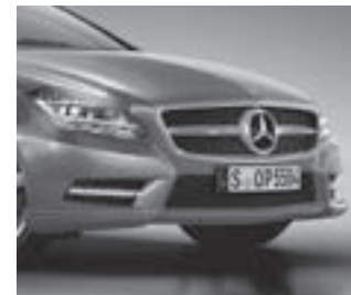
AMG Frontschürze mit LED-Tagfahr.