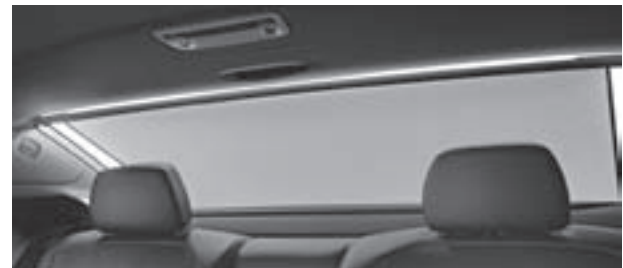
Rollo elektrisch für Heckfenster