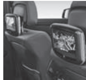
Fond Entertainment System Kit