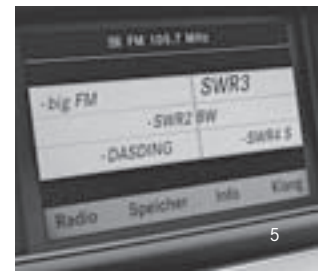
Audio 20 Radio CD Display