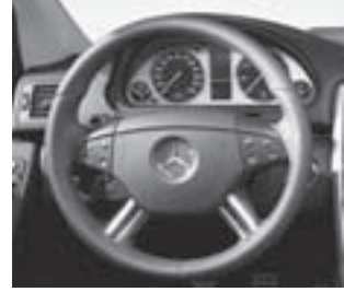
Lenkrad mit 2 Aluspangen