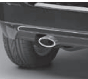
Auspuffendrohr oval in Edelsstahl