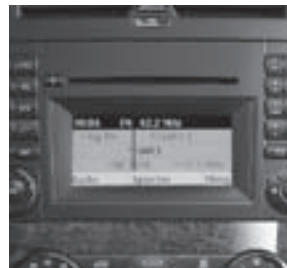
Audio 20 CD