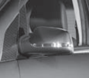
Außenspiegel in Wagenfarbe