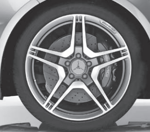
AMG Schmiederäder (793)