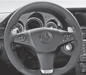
AMG Performance Lenkrad