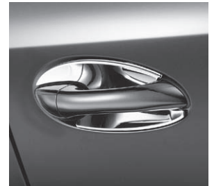
Türgriffschale, hochglanz verchromt