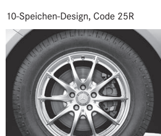
10-Speichen-Design, Code 25R