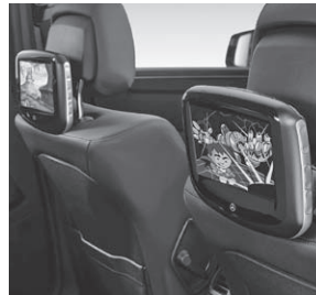
Fond Entertainment System Kit