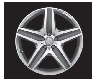
AMG 5-Speichen-Design, Code 758