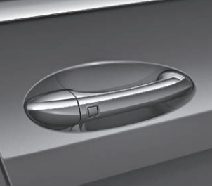
Türgriffe mit Chromeinleger