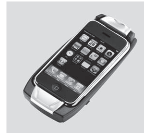
Aufnahmeschale für Apple iPhone