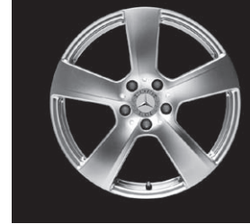
5-Speichen-Design (Code R32/R96)

* tagesaktuelle Konditionen unter www.mercedes-benz-bank.de (siehe Hinweis auf Seite 4)