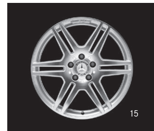
AMG Doppelsp.-Design (781/786)