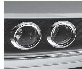
Tagfahrleuchte und Nebelscheinwerfer