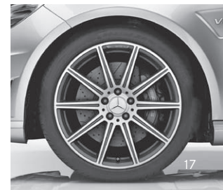
AMG Leichtmetallräder (796/797)