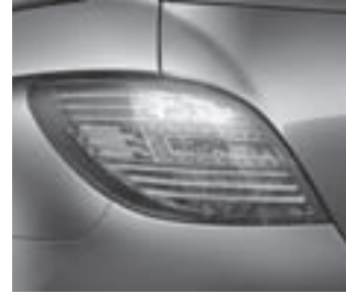
Heckleuchte in LED-Technik

Leichtmetallräder 4fach, 10-Speichen-Design, 8 J x 18 ET 67, Reifengröße 255/55 R 18, Code R41 (300 CDI BlueEFFICIENCY und 350 BlueTEC 10-Speichen-Design 7,5 J x 17 ET 56, Reifengröße 235/65 R 17, Code 25R)