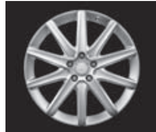
10-Speichen-Design, Code R26