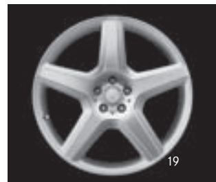
AMG 5-Speichen-Design, Code 777