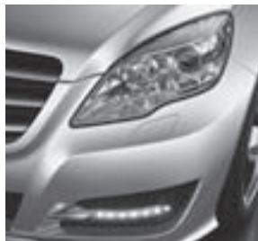
Bi-Xenon-Scheinwerfer mit LED-Tagfahrlicht