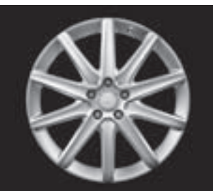
10-Speichen-Design, Code R26