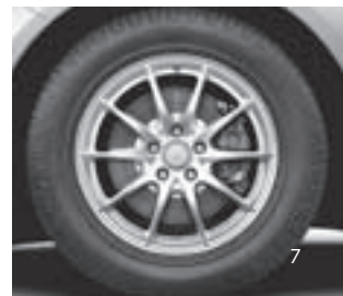
10-Speichen-Design, Code 25R