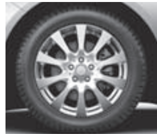
10-Speichen-Design, Code R41