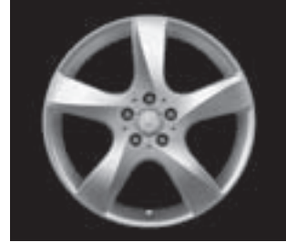
5-Speichen-Design, Code R39