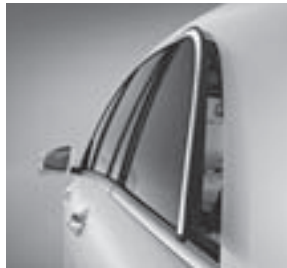
Seitenfenster hinten elektrisch ausstellbar