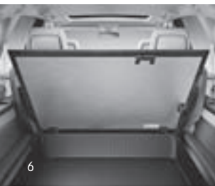
Staufach im Kofferraumboden