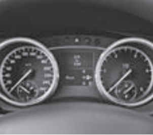
Kombiinstrument in Tubenoptik