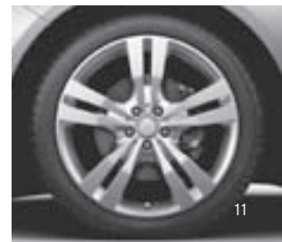
5-Doppelsp.-Design, Code R33