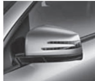
Außenspiegel mit LED-Leuchte