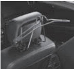
Mercedes-Benz Kleiderbügel an Kopfstütze