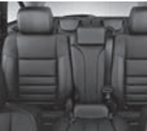
AMG Sportsitze in Leder Nappa