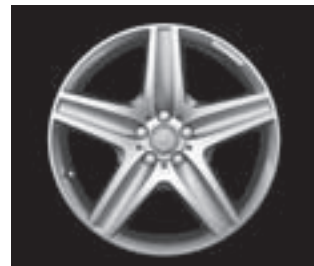
AMG 5-Speichen-Design, Code 758