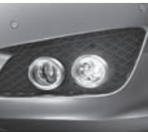
Leuchten mit Chromumrandung