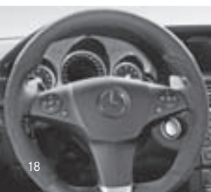
AMG Performance Lenkrad