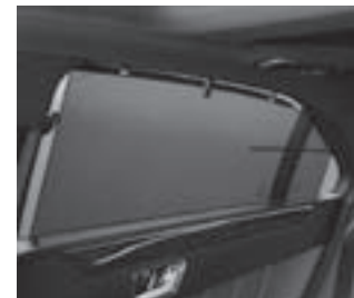
Rollo in den Fondtüren