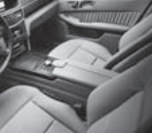
Polsterung Leder Nappa