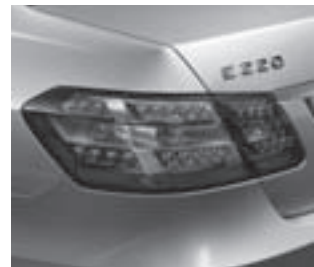
Heckleuchten in LED-Ausführung