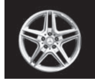
AMG 5-Doppelsp.-Design (791/795)

* tagesaktuelle Konditionen unter www.mercedes-benz-bank.de (siehe Hinweis auf Seite 4)