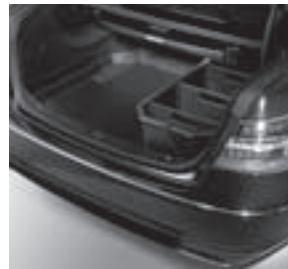
Kofferraumwanne, flach mit Staubbox