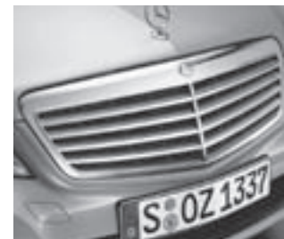
Kühlergrill silber lackiert