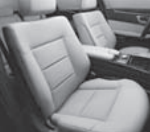
Polsterung Stoff Biarritz/ARTICO