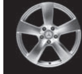
5-Speichen-Design (Code R32/R96)

* tagesaktuelle Konditionen unter www.mercedes-benz-bank.de (siehe Hinweis auf Seite 4)