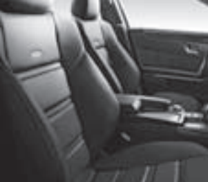
AMG Sportsitze vorne