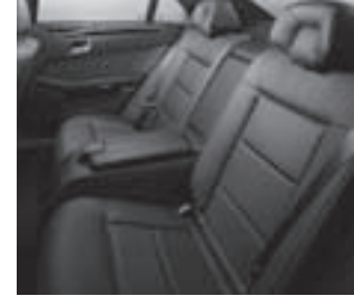
Komfort-Einzelsitze im Fond

Rollo elektrisch für Heckfenster, Rollo mechanisch in den Fondtüren und Komfort-Doppelsonnenblenden (ausziehbar, zweiteilig aufklappbar) mit Make-up Spiegel