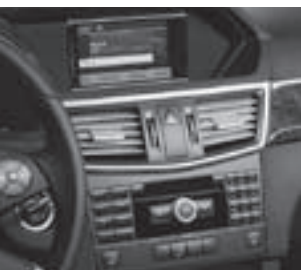
Radio Audio 20 CD