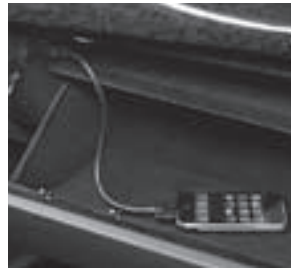
Media Interface 1)