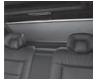
Rollo elektrisch für Heckfenster