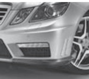
AMG Exterior Carbon-Paket