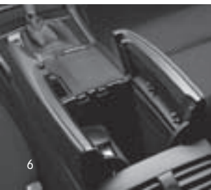
Ablagefach in Mittelkonsole