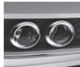
Tagfahrleuchte u. Nebelscheinwerfer