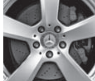
Bremsscheiben vorne gelocht