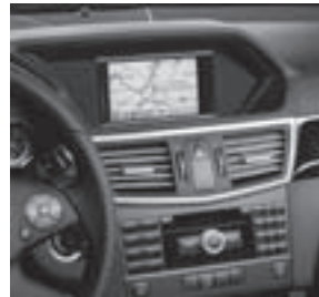
Audio 50 APS