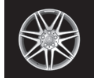
AMG 7-Doppelsp.-Design (770)