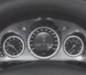
Kombiinstrument in silber