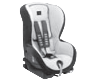
Kindersitz DUO plus