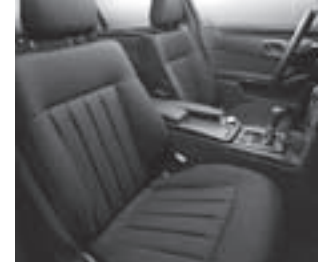
Polsterung Stoff Toulon

Nebelscheinwerfer und Tagfahrleuchten mit Chromringen