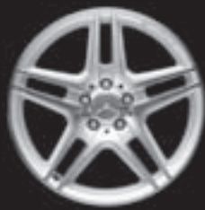
AMG 5-Doppelsp.-Design (786)