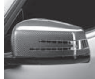
AMG Carbon Außenspiegel

* tagesaktuelle Konditionen unter www.mercedes-benz-bank.de (siehe Hinweis auf Seite 4)