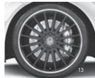
AMG Vielspeichen-Design (797)