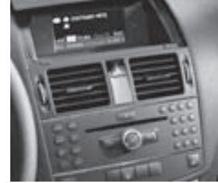
Audio 50 APS

* tagesaktuelle Konditionen unter www.mercedes-benz-bank.de (siehe Hinweis auf Seite 4)