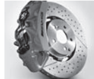
AMG Verbundbrems scheibe