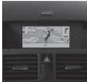
Universal Media Interface