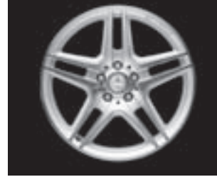
AMG 5-Doppelspei.-Design (786)