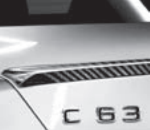
AMG Carbon Abrisskante