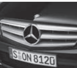
Lamellenkühler mit Stern