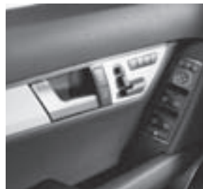
Vordersitz links mit Memory-Paket