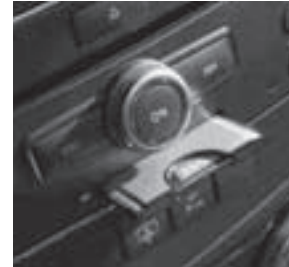
PCMCIA Multi-Card Reader