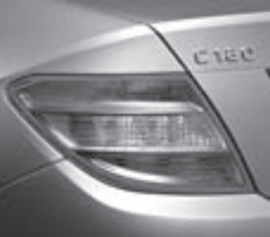
Schlussleuchte in Klarglas