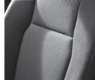
Polsterung Stoff »Brighton«