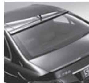
Dach- und Heckspoiler