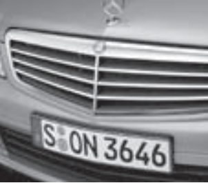
Lufteinlass, schwarze Lamellen