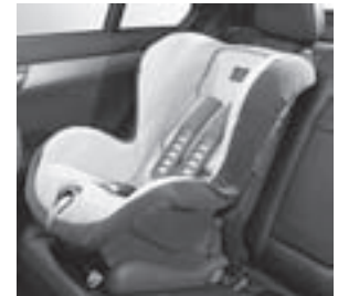
Kindersitz DUO plus