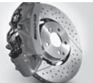
AMG Verbundbrems Scheibe