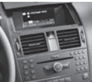
Audio 50 APS