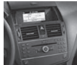
Audio 20 CD