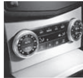
3-Zonen-Komfort-Klimatisierungs- automatik THERMOTRONIC