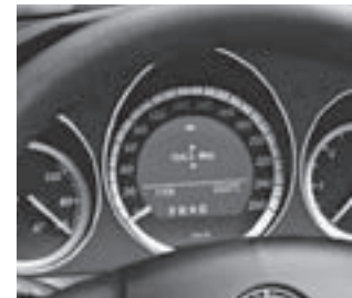
Display im Kombiinstrument