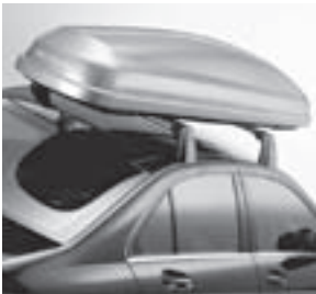
Grundträger New Alustyle, Mercedes-Benz Dachbox