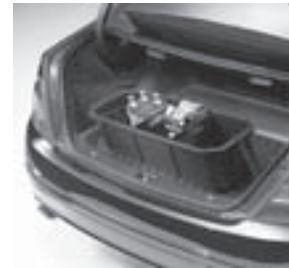
Kofferraumwanne, flach mit Staubox