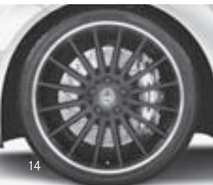
AMG Vielspeichen-Design (797)