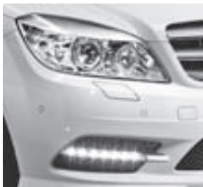
Intelligent Light System mit LED-Tagfahrleuchte