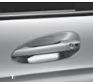
Türgriffe in Wagenfarbe lackiert