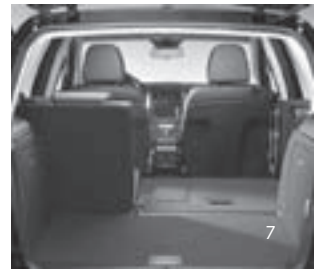
Fondsitzbank 1/3 : 2/3 geteilt