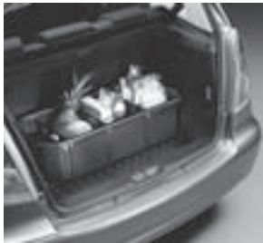
Kofferraumwanne, flach mit Staubbox