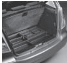
Ablageschale unter Ladeboden