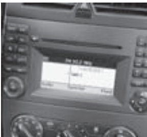
Audio 20 CD