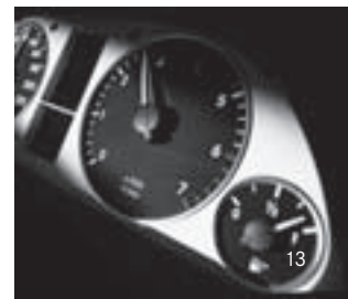
Kombiinstrument in Silber