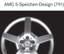
AMG 5-Speichen-Design (791)