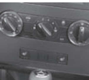
Klimaanlage und Umluftschalter