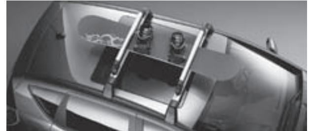
Grundträger New Alustyle, Ski- und Snowboardhalter New Alustyle