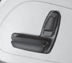
Vordersitze elektrisch verstellbar