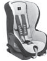
Kindersitz DUO plus