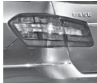
Heckleuchte in LED-Ausführung