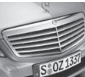
Kühlergrill silber lackiert