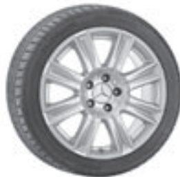
17" Haidea, 8-Speichen-Design