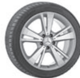
18" Chegra, 5-Doppelspeichen-Design