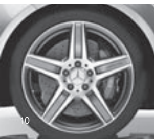
AMG 18" Leichtmetallrad