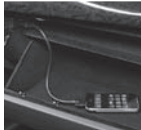
Media Interface 1)