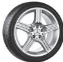
18" Sinnif, 5-Speichen-Design