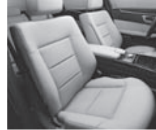
Polsterung Stoff Biarritz/ARTICO

DIRECT CONTROL-Fahrwerk, sportlich abgestimmt und tiefergelegt (E 200 CDI BlueEFFICIENCY – E 350 CDI 4MATIC BlueEFFICIENCY E 200 CGI BlueEFFICIENCY – E 350 4MATIC)