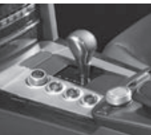
AMG DRIVE UNIT