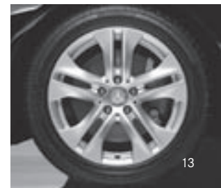
5-Doppelspeichen-Design (R 11)