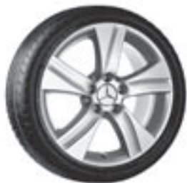
17" Gulshorn, 5-Speichen-Design