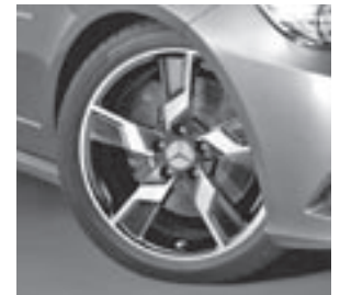
18" Xentres, 5-Speichen-Design