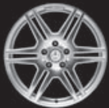
AMG Doppelsp.-Design (781/786)