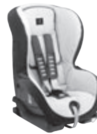
Kindersitz DUO plus