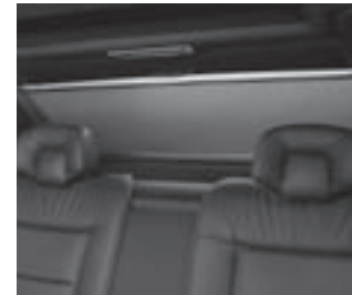
Rollo elektrisch für Heckfenster