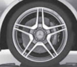
AMG 19" Schmiederäder (793)