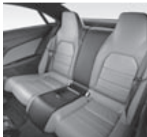
Fondsitzeanlage Leder schwarz/flamencorot