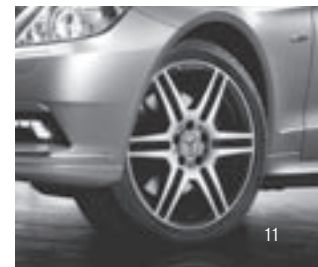
18" AMG 6-Doppelspeichen-Design

Berechnung der Monatsraten für das Sondermodell Prime Edition auf Basis eines E 350 CDI BlueEFFICIENCY, Stand 01/09.