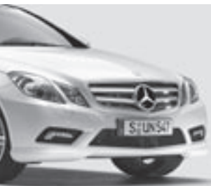
AMG Frontschürze 7)