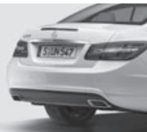
AMG Heckschürze 8)