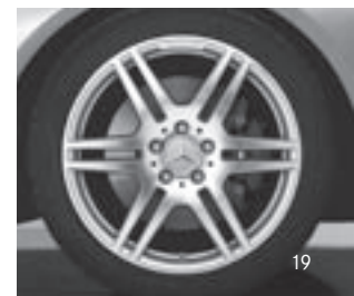
18" AMG 6-Doppelsp.-Design (786)