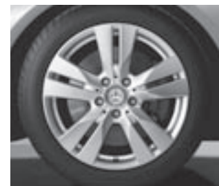
17" 5-Doppelspeichen-Design (R52)