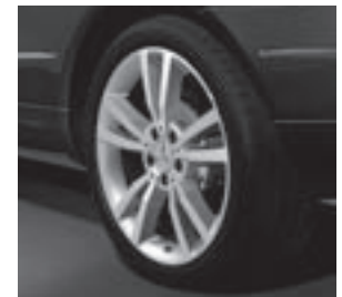
18" Shikrio, 5-Speichen-Design