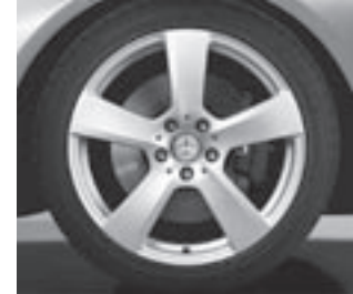
17" 5-Speichen-Design (R32)