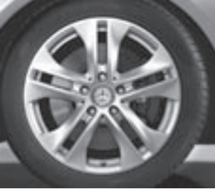
17" 5-Doppelspeichen-Design (1R7)