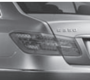
Heckleuchten in LED-Ausführung