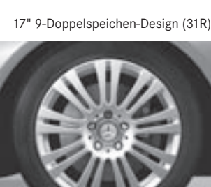
17" 9-Doppelspeichen-Design (31R)