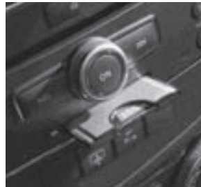
PCMCIA Multi-Card Reader