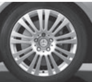
16" 9-Doppelspeichen-Design (3R2)