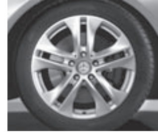
17" 5-Doppelspeichen-Design (R11)

* tagesaktuelle Konditionen unter www.mercedes-benz-bank.de (siehe Hinweis auf Seite 4)