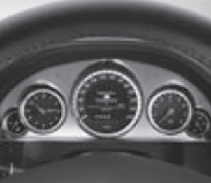
Kombiinstrument in Tubenoptik