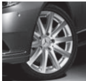
16" Lugo, 10-Speichen-Design