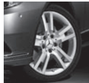
17" Khotrima, 5-Doppelspeichen-Design