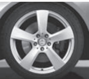
18" 5-Speichen-Design (2R8)