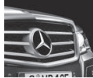
Kühlergrill mit 3 Chromlamellen

* tagesaktuelle Konditionen unter www.mercedes-benz-bank.de (siehe Hinweis auf Seite 4)