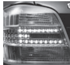
Intelligent Light System Heckleuchte