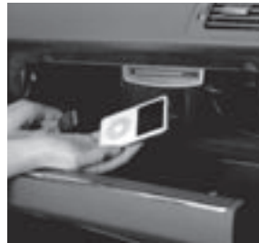
Universal Media Interface