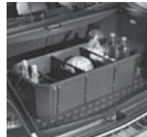
Kofferraumwanne, flach mit Staubox