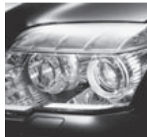
Intelligent Light System Frontscheinwerfer