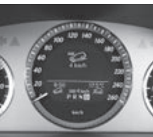
Downhill Speed Regulation (430)