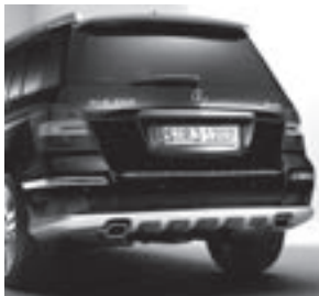
Heckschürzenblende mit Diffusor