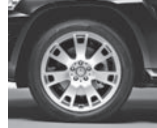
7-Speichen-Design 19" (38R)

* tagesaktuelle Konditionen unter www.mercedes-benz-bank.de (siehe Hinweis auf Seite 4)