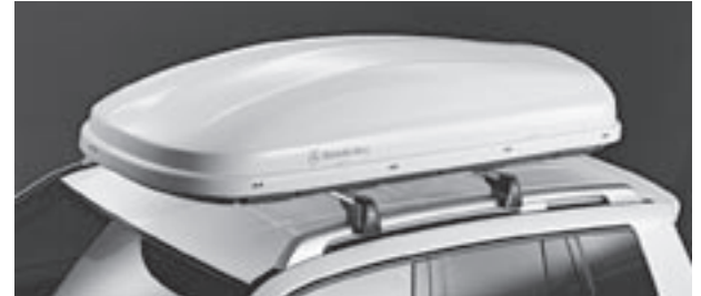
Grundträger New Alustyle, Mercedes-Benz Dachbox