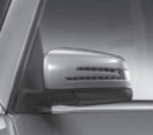
Außenspiegel mit Blinkleuchte