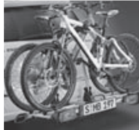
Heckfahrradträger auf Anhängervorrichtung