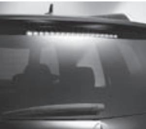
3. Bremsleuchte in LED-Technik