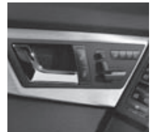
vollelektrische Sitzverstellung inkl. Memoryfunktion