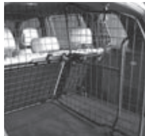
Trenngitter mit Raumteiler