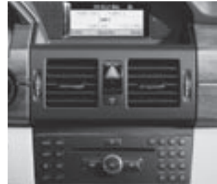
Audio 20 CD