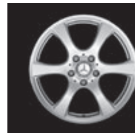
17" 6-Speichen-Design (R74)