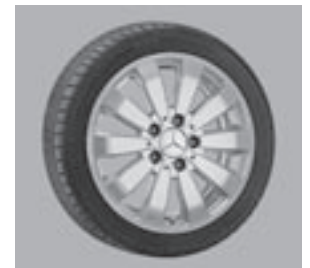
16" Anshan, 10-Speichen-Design