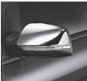
Außenspiegel-Gehäuse, hochglanz verchromt