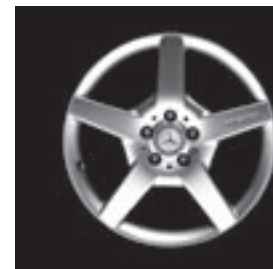
18" AMG 5-Speichen-Design (791)