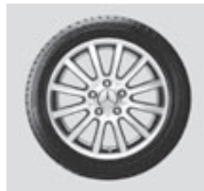
16" Kochab, 12-Speichen-Design