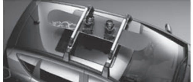
Grundträger New Alustyle, Ski- und Snowboardhalter New Alustyle