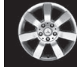
16" 7-Speichen-Design (R20)

7) anstelle Sommerreifen; Reifengröße 185/65 R 15 oder 195/55 R 16; Höchstgeschwindigkeit 190 km/h; nicht in Verbindung mit Sport-Paket, Code 952