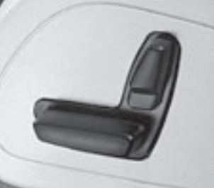
Vordersitze elektrisch verstellbar