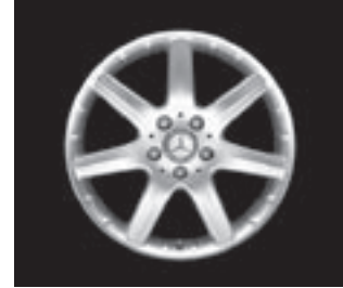
17" 7-Speichen-Design (603)