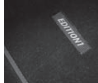
Fußmatten »EDITION 1«

Sport-Paket »EXTERIEUR« Lackierung calcitweiß 3) 20" Leichtmetallräder 4fach, 5-Doppelspeichen-Design (Code R98), VA: 8,5J x 20 ET 45, Reifengröße 235/45 R20 HA: 9,5J x 20 ET 57, Reifengröße 255/40 R20