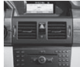
Audio 20 CD