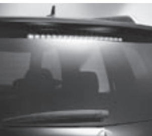
3. Bremsleuchte in LED-Technik