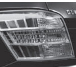
Heckleuchte in Klarglasausführung