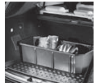
Kofferraumwanne, flach mit Staubbox