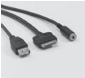
Media Interface Consumer-Kabel Kit