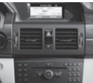
Audio 50 APS