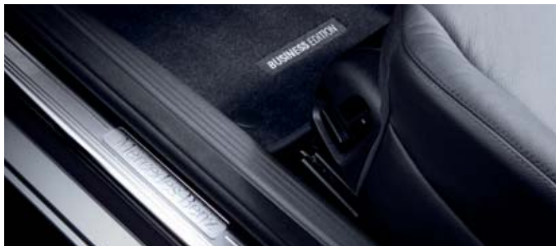
Fußmatten mit Logo „BUSINESS EDITION“