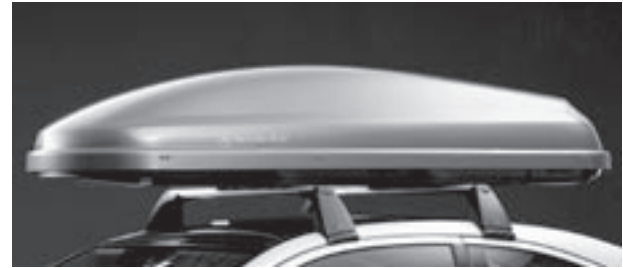
Grundträger New Alustyle, Mercedes-Benz Dachbox