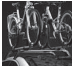
Grundträger New Alustyle, Fahrradhalter New Alustyle