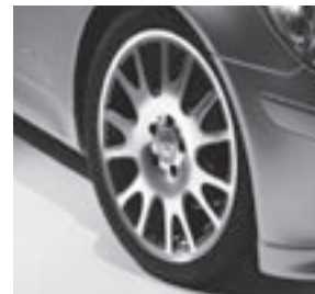
18" Alresha, Vielspeichen-Design