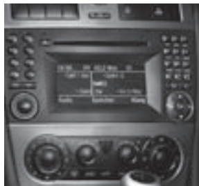
Audio 50 APS