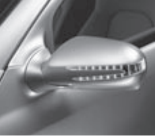
Außenspiegel mit LED-Blinker