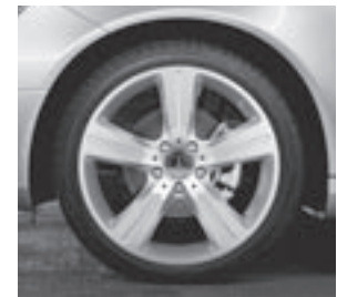
18" Almuredin, 5-Speichen-Design