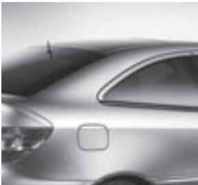
Dunkel getöntes Glas