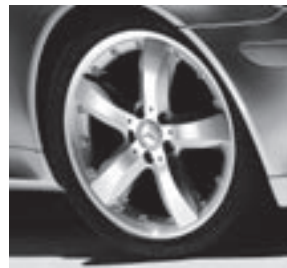
18" Sadachiba, 5-Speichen-Design