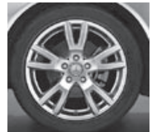
Leichtmetallrad 5-Doppelspeichen-Design (R95)