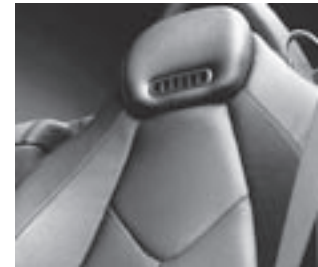
Sitze mit roter Ziernaht