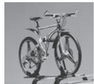
Grundträger New Alustyle, Fahrradhalter New Alustyle