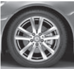
17" Kikuchi, 5-Doppel-Speichen-Design