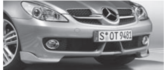
Frontschürzenspoilerlippen, Chromzierteile für Querfinnen im Kühlersteg und Stoßfänger