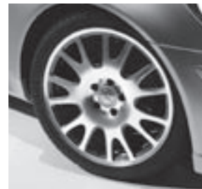
18" Alresha, Viel-Speichen- Exklusiv-Schmiede-Design