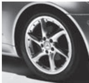
17" Elarneb, 6-Speichen-Design