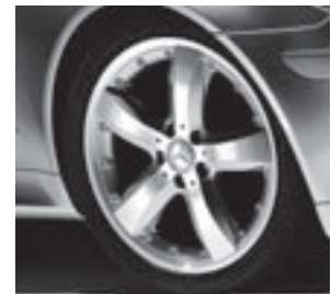
18" Sadachiba, 5-Speichen-Design