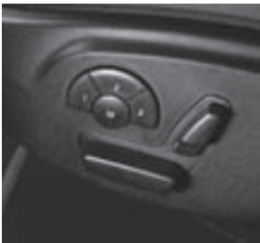
elektrische Sitzverstellung mit Memory