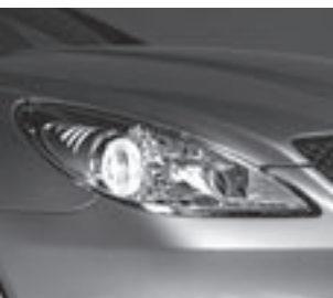
Scheinwerfer in Klarglas