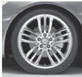
18" Korsunia, 5-Triple-Speichen-Design