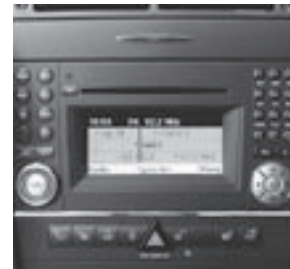
Audio 50 APS