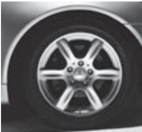
16" Acubens, 6-Speichen-Design