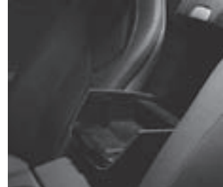
Ablagebox an der Rückwand