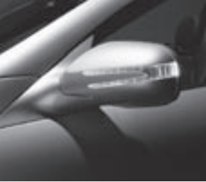
Blinkleuchte in Außenspiegel