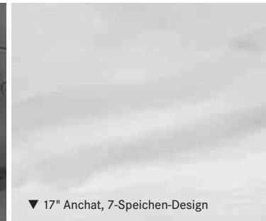
▼ 17" Anchat, 7-Speichen-Design