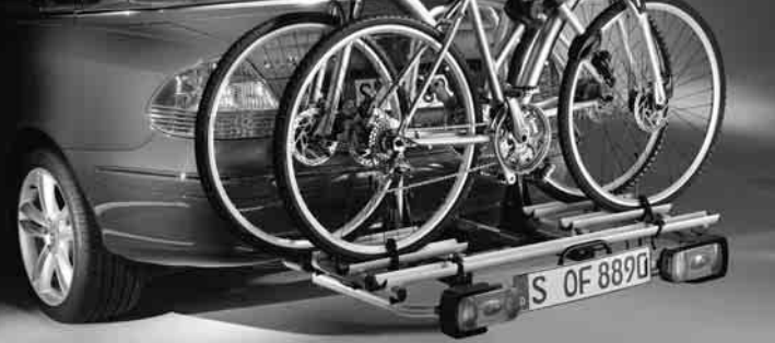
◀ Heckfahrradträger für Anhängervorrichtung