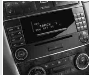
▲ Radio »Audio 20«