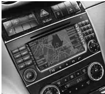
◀ »COMAND APS«