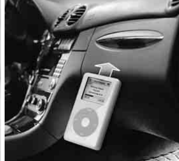
iPod Interface Kit ▶