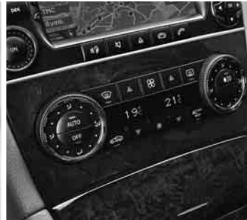
◀ Klimaanlage »THERMOTRONIC«