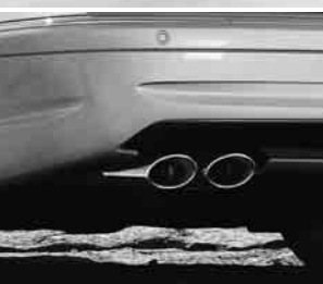
AMG Doppelendrohr ▲