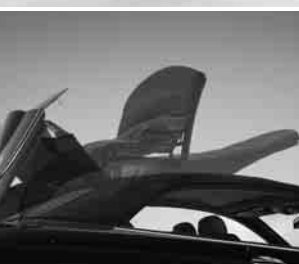
Verdeck vollautomatisch ▲