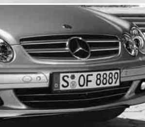
Kühlergrill lackiert ▲