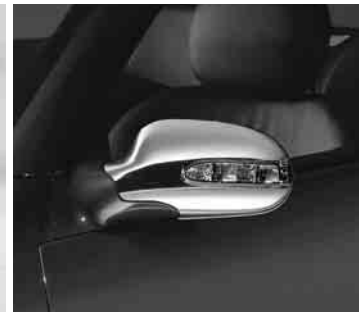
◀ Außenspiegel-Gehäuse, verchromt