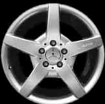
5-Speichen-Design AMG ▼