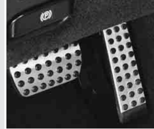
▲ Sportpedalerie in Aluoptik