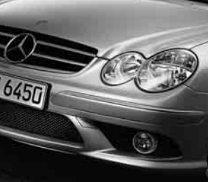
AMG Frontschürze ▲