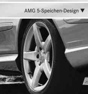
AMG 5-Speichen-Design ▼