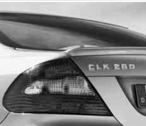
AMG Abrisskante ▲