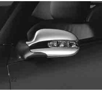
Außenspiegel-Gehäuse, verchromt ▼