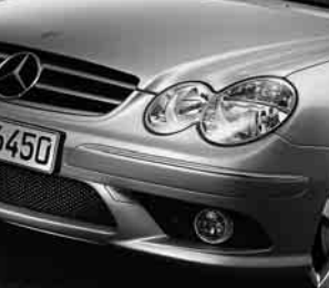
AMG Frontschürze ▲