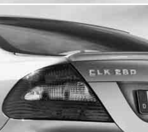
AMG Abrisskante ▲