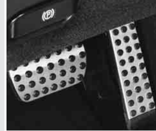
▲ Sportpedalerie in Aluoptik