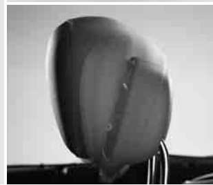
▼ Kopfstützensystem NECK PRO