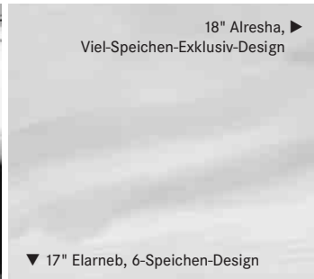
▼ 17" Elarneb, 6-Speichen-Design