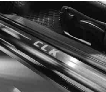
▲ Beleuchtete Einstiegsschienen, Fußmatten Gummi