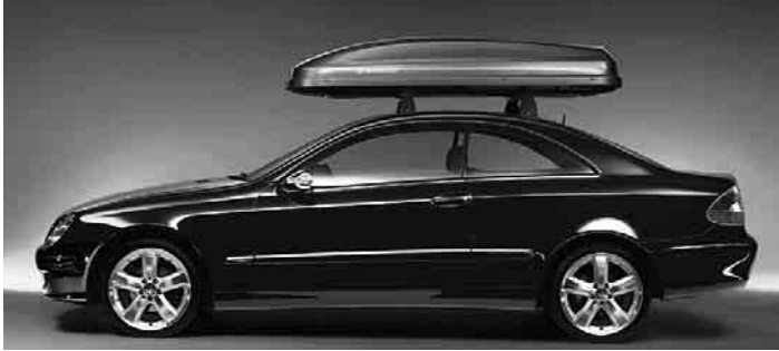
◀ Grundträger Alustyle, Mercedes-Benz Dachbox