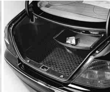
Kofferraumwanne, flach, Schublade unter Hutablage ▶