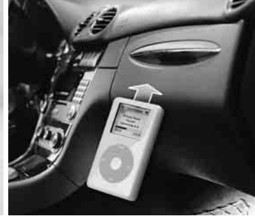
iPod Interface Kit ▶