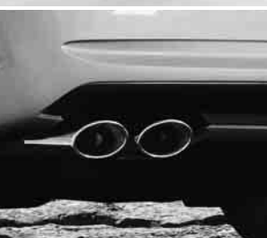
AMG Doppelendrohr ▲