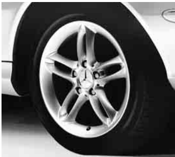
▲ 16" Aldebaran, 5-Doppelspeichen-Design