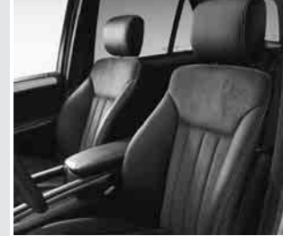
▲ Sportsitze vorne