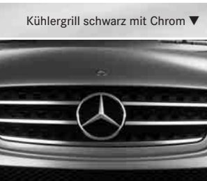
Kühlergrill schwarz mit Chrom ▼