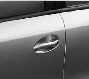
Türgriffe in Wagenfarbe ▼

Tipp-Wischfunktion für Frontscheibenwischer, Heckscheibenwischer mit automatischer Zuschaltung bei Rückwärtsfahrt, Heckscheibenwischer mit Intervallsystem