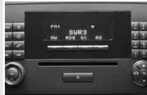
▼ Radio »Audio 20«