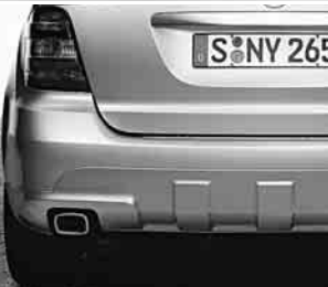
AMG Heckschürze ▲