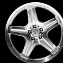
▼ 20" AMG 5-Speichen-Design