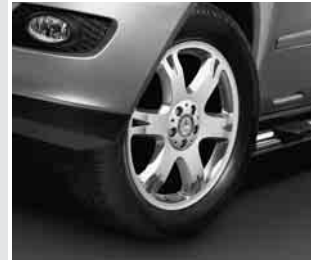
▲ 19" 6-Speichen-Design