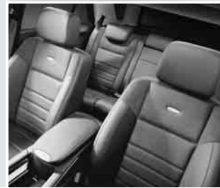
▼ AMG Sportsitze