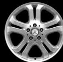
▲ 18" 5-Doppelspeichen-Design