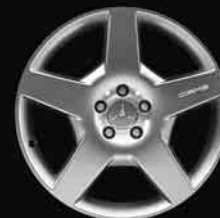
▲ 19" AMG 5-Speichen-Design