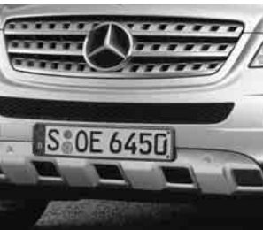
Optischer Unterfahrschutz ▲