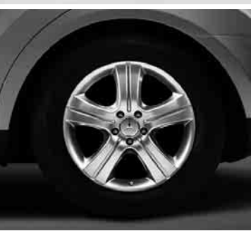
◀ 18" Mintaka, 5-Speichen-Design