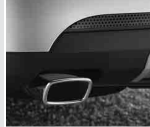
▲ Auspuffblende rechteckig