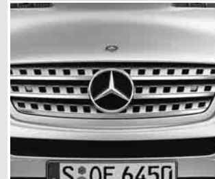
▲ Kühlergrill Sterlingsilber