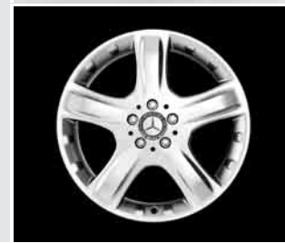
▼ 19" 5-Speichen-Design