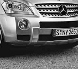
AMG Frontschürze ▲