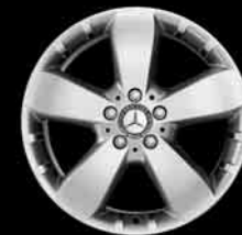
▲ 18" 5-Speichen-Design

7) nur in Verbindung mit Reifengröße 255/50 R 19