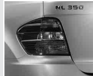
▲ Rückleuchte in Sportoptik