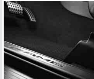
▲ AMG Einstiegsleiste