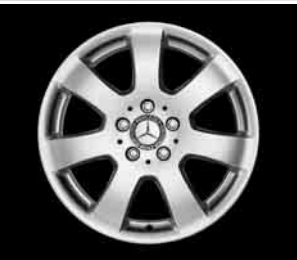
17" 7-Speichen-Design ▲