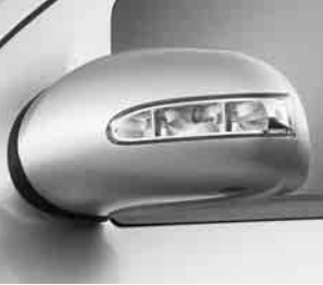
Außenspiegel mit Blinkleuchte ▲