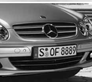
Kühlergrill lackiert ▲