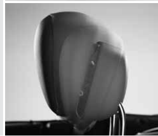
▼ Kopfstützensystem NECK PRO