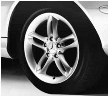
▲ 16" Aldebaran, 5-Doppelspeichen-Design