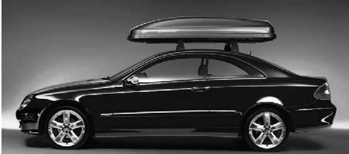
◀ Grundträger Alustyle, Mercedes-Benz Dachbox