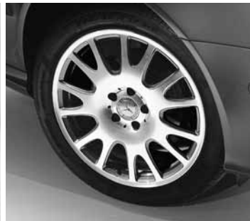
▼ 17" Anchat, 7-Speichen-Design