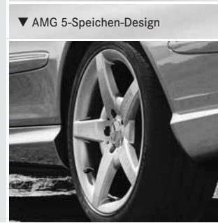
▼ AMG 5-Speichen-Design