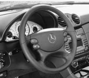
Schaltasten am Lenkrad ▲