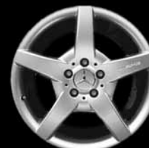
▼ 5-Speichen-Design AMG