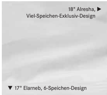
▼ 17" Elarneb, 6-Speichen-Design