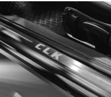
▲ Beleuchtete Einstiegsschienen, Fußmatten Gummi