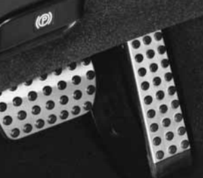
Sportpedalerie in Aluoptik ▲