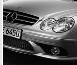
▲ AMG Frontschürze

Frontschürze, Seitenschwellerverkleidung, Heckschürze