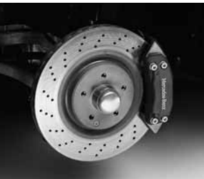
Bremsscheiben gelocht ▲