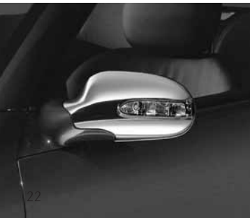
Außenspiegel-Gehäuse, verchromt ▼