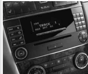
▲ Radio »Audio 20«