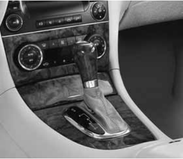
▲ Schalt-/Wählhebel in Holzausführung