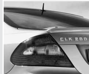
▲ AMG Abrisskante