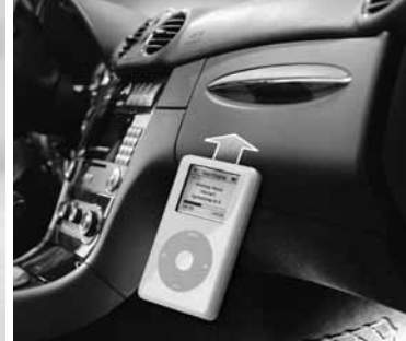
iPod Interface Kit ▶