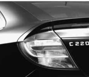
Bremsleuchte in Klarglas ▲