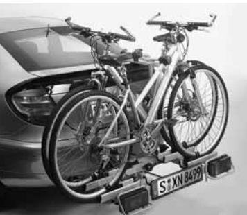
◀ Heckfahrradträger für Anhängervorrichtung