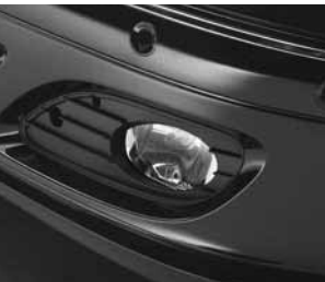
Nebelscheinwerfer in Klarglas ▲