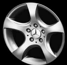
16" 5-Speichen-Design ▲