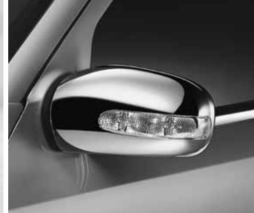
▶ Außenspiegel-Gehäuse, verchromt