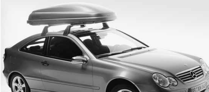
◀ Grundträger Alustyle, Mercedes-Benz Dachbox