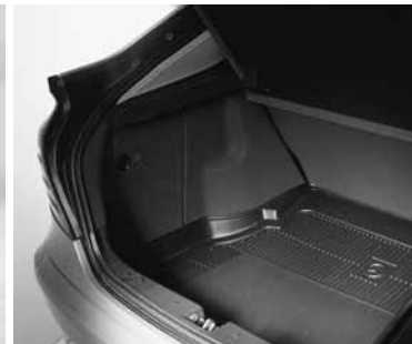
▲ Kofferraumwanne, flach