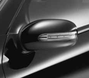
Blinkleuchte in Außenspiegel ▲