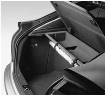
◀ Ablagebox unter Hutablage