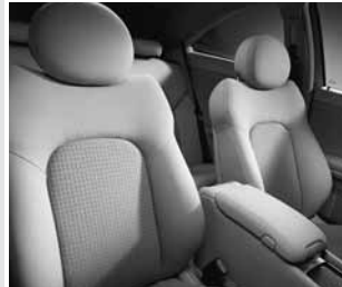
▲ Polsterung Stoff »Leeds«