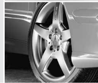
▼ 5-Speichen-Design AMG