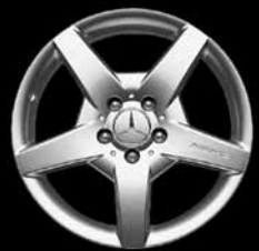
18" 5-Speichen-Design AMG ▲