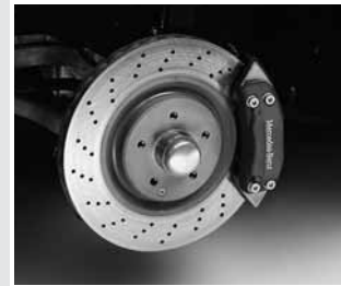
▲ Bremsscheiben gelocht