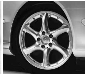
◀ Aldebaran, 5-Doppelspeichen-Design