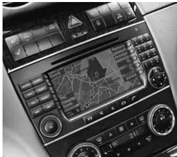
◀ »COMAND APS«