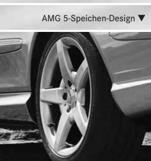
AMG 5-Speichen-Design ▼