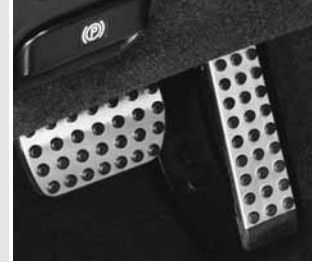
▲ Sportpedalerie in Aluoptik