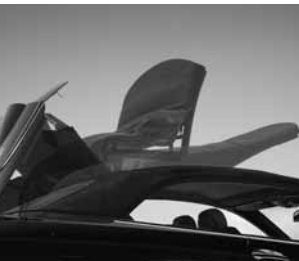
Verdeck vollautomatisch ▲