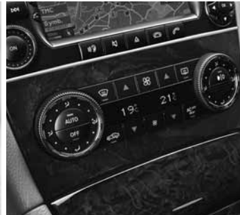
◀ Klimaanlage »THERMOTRONIC«