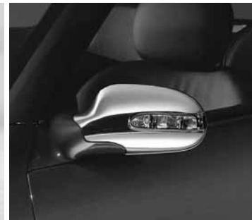
◀ Außenspiegel-Gehäuse, verchromt