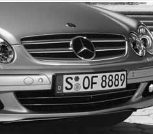
Kühlergrill lackiert ▲