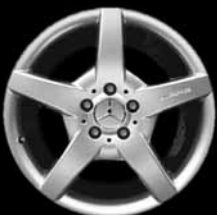
5-Speichen-Design AMG ▲