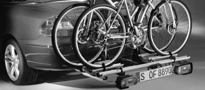
◀ Heckfahrradträger für Anhängervorrichtung