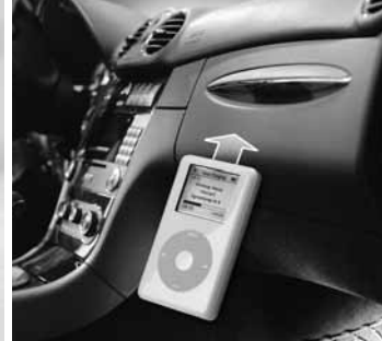
iPod Interface Kit ▶