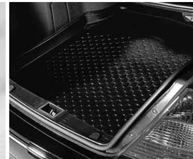
Kofferraumwanne, flach ▶