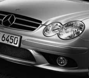
AMG Frontschürze ▲