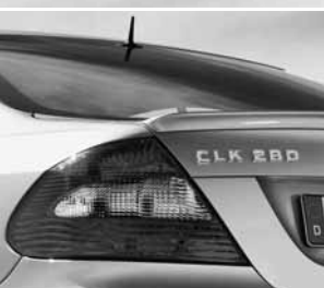
AMG Abrisskante ▲