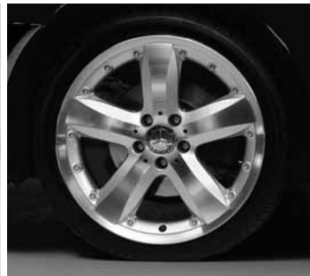
Alresha, Viel-Speichen-Exklusiv-Design ▶