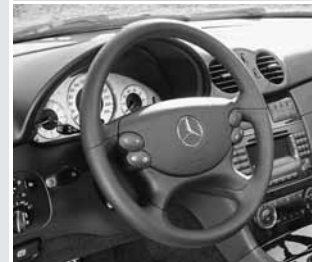
▲ Schalttasten am Lenkrad