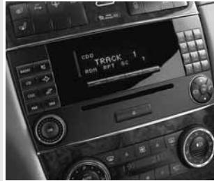
▲ Radio »Audio 20«