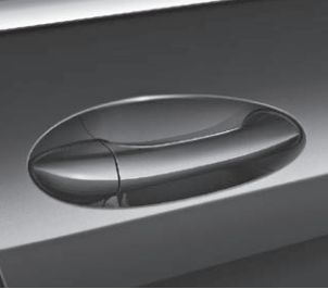
Türgriff in Wagenfarbe