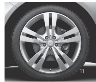
5-Doppelsp.-Design, Code R33