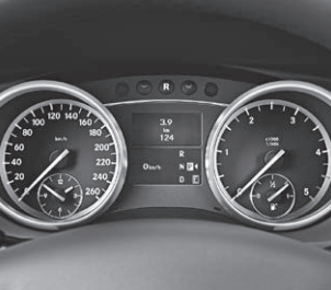
Kombiinstrument in Tubenoptik