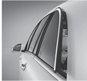
Seitenfenster hinten elektrisch ausstellbar