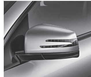
Außenspiegel mit LED-Leuchte