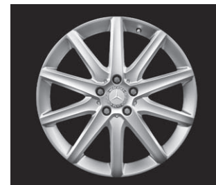
10-Speichen-Design, Code R26