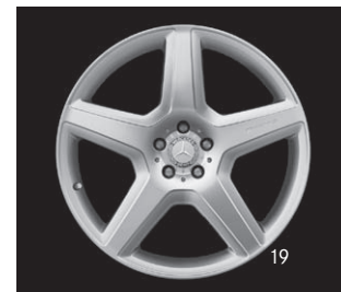
AMG 5-Speichen-Design, Code 777