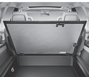
Staufach im Kofferraumboden