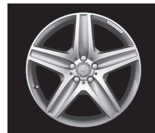
AMG 5-Speichen-Design, Code 758