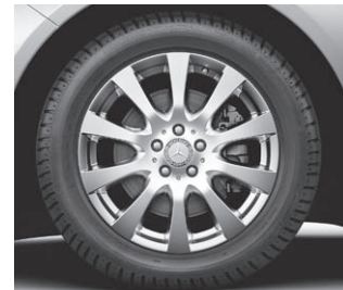
10-Speichen-Design, Code R41