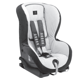
Kindersitz DUO plus