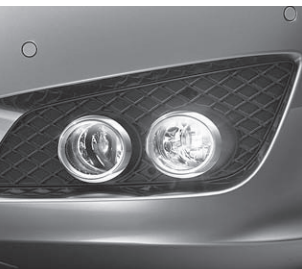
Leuchten mit Chromumrandung