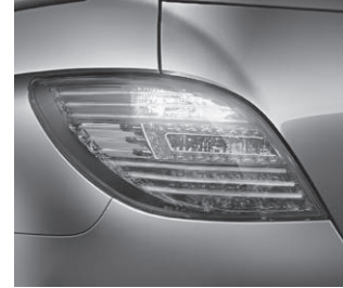
Heckleuchte in LED-Technik

Leichtmetallräder 4fach, 10-Speichen-Design, 8 J x 18 ET 67, Reifengröße 255/55 R 18, Code R41 (300 CDI BlueEFFICIENCY und 350 BlueTEC 10-Speichen-Design 7,5 J x 17 ET 56, Reifengröße 235/65 R 17, Code 25R)