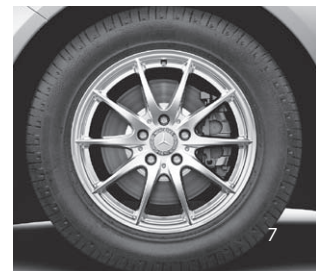
10-Speichen-Design, Code 25R