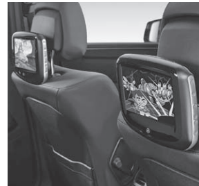
Fond Entertainment System Kit