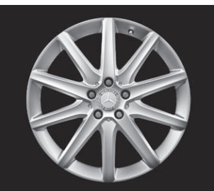
10-Speichen-Design, Code R26