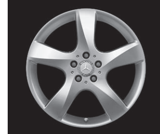
5-Speichen-Design, Code R39