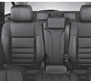
AMG Sportsitze in Leder Nappa