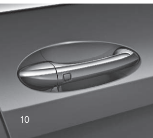
Türgriffe mit Chromeinleger