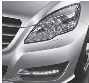
Bi-Xenon-Scheinwerfer mit LED-Tagfahrlicht