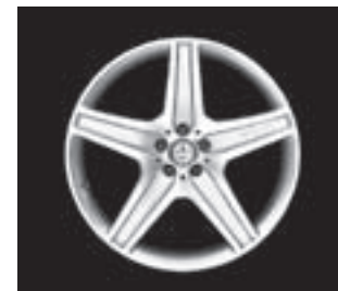
AMG 5-Speichen-Design (777)