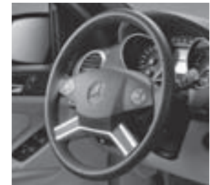
Multifunktionslenkrad in Leder-/Holzausführung