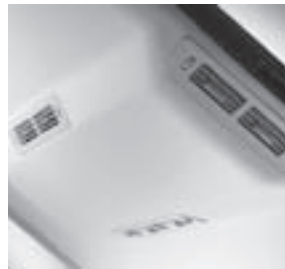
Klimaanlage im Fond