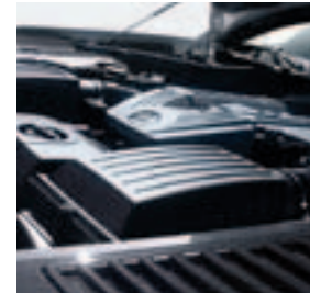
AMG Carbon Motorraumabdeckung