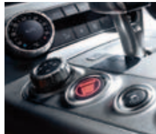
AMG DRIVE UNIT