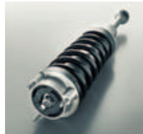
AMG Performance Fahrwerk