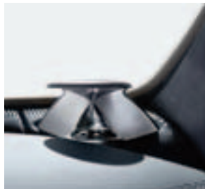
Hochtöner, Bang & Olufsen BeoSound AMG