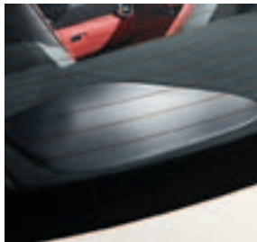
Subwoofer, Bang & Olufsen BeoSound AMG