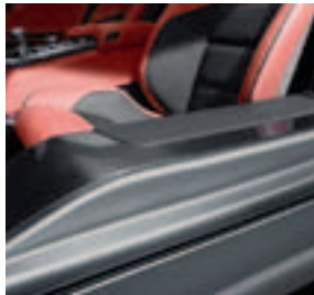
Einstiegsleiste Carbon, AMG Carbon-Paket Interieur