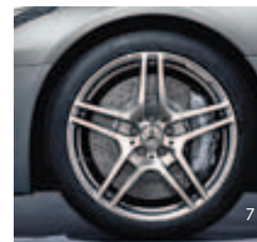
19"/20" 5-Doppelsp.-Design (764)