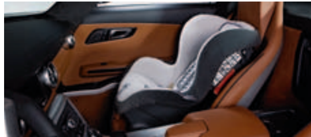
Kindersitz DUO plus