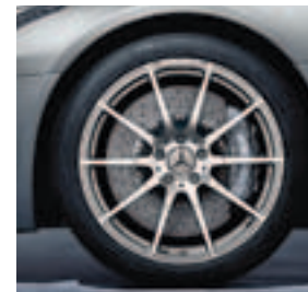
19"/20" 10-Sp.-Design (766)