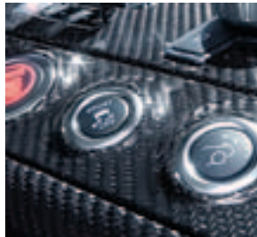
AMG Zierelemente Carbon