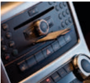
PCMIA Multi-Card Reader mit SD-Karte