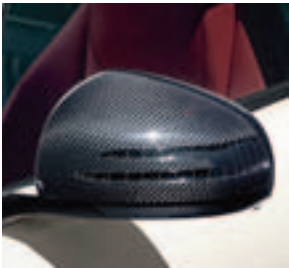
AMG Carbon Außenspiegel