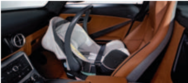
Kindersitz BabySafe plus