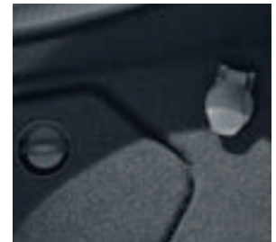
Vorrüstung für Batterieladegerät im Kofferraum