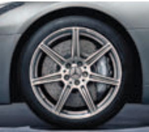
19"/20" 7-Sp.-Design (Code 765)