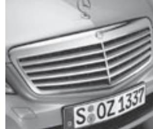
Kühlergrill silber lackiert