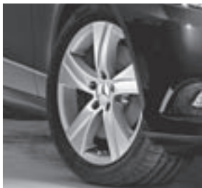
17" Gulshorn, 5-Speichen-Design