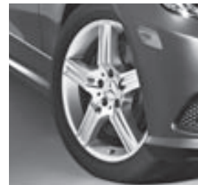
18" Sinnif, 5-Speichen-Design