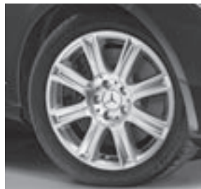
17" Haidea, 8-Speichen-Design