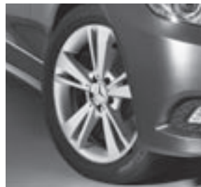
18" Chegra, 5-Doppelspeichen-Design