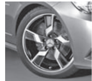
18" Xentres, 5-Speichen-Design