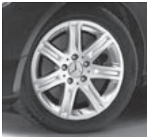
16" Shayni, 7-Speichen-Design