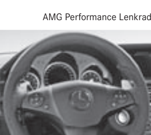
AMG Performance Lenkrad