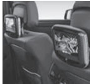
Fond Entertainment System Kit