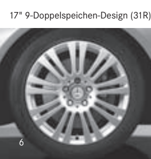
17" 9-Doppelspeichen-Design (31R)