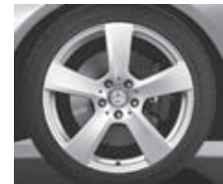
18" 5-Speichen-Design (2R8)