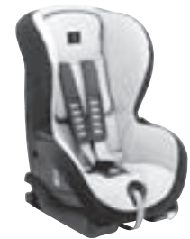
Kindersitz DUO plus