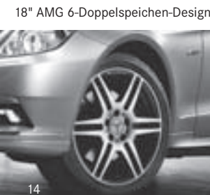
18" AMG 6-Doppelspeichen-Design