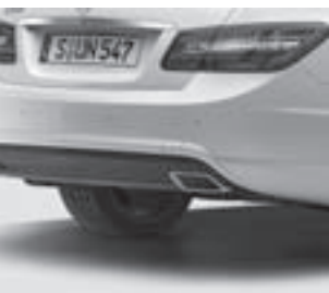
AMG Heckschürze 7)