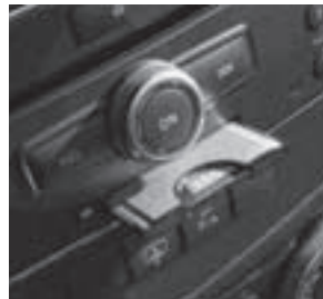
PCMCIA Multi-Card Reader