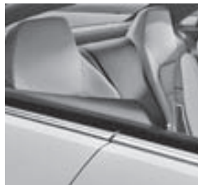
Sitzanlage im Fond