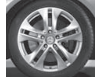
17" 5-Doppelspeichen-Design (1R7)

* tagesaktuelle Konditionen unter www.mercedes-benz-bank.de (siehe Hinweis auf Seite 4)