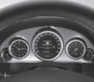
Kombiinstrument in Tubenoptik