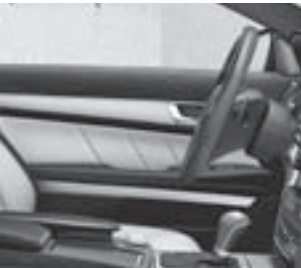
Türmittelfelder in designo Leder