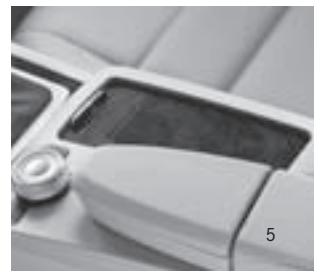
Ablagefach mit Rolloabdeckung