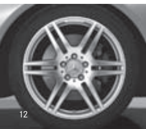
18" AMG 6-Doppelspeichen-Design