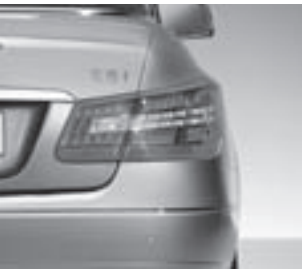
Heckleuchten in LED-Ausführung