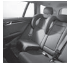
Fondsitz mit integriertem Kindersitz