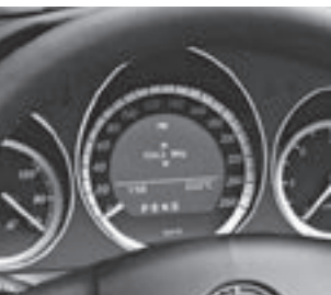
Display im Kombiinstrument