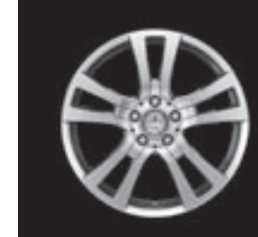
18" 5-Doppelspeichen-Design (R70)