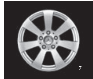
16" 7-Speichen-Design (R75)