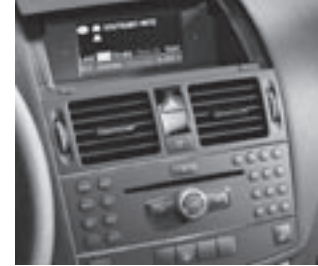
Audio 50 APS

* tagesaktuelle Konditionen unter www.mercedes-benz-bank.de (siehe Hinweis auf Seite 4)