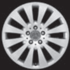
17" 12-Speichen-Design (R80)