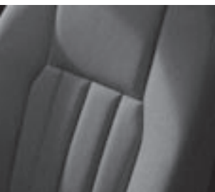
Polsterung Stoff »Edinburgh«