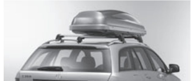
Grundträger New Alustyle, Mercedes-Benz Dachbox