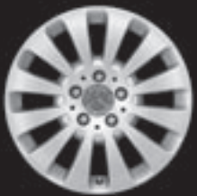
17" 12-Speichen-Design (1R8)