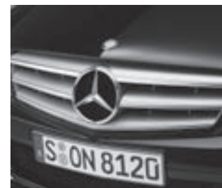
Lamellenkühler mit Stern