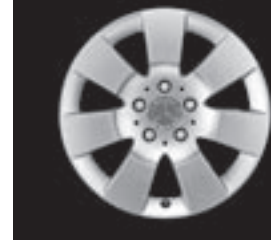
16" 7-Speichen-Design (R18)

* tagesaktuelle Konditionen unter www.mercedes-benz-bank.de (siehe Hinweis auf Seite 4)