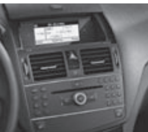
Audio 20 CD