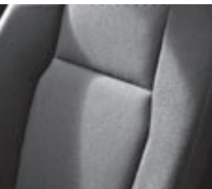
Polsterung Stoff »Brighton«