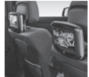
Fond Entertainment System