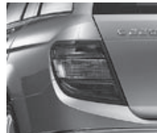
Schlussleuchte in Klarglas