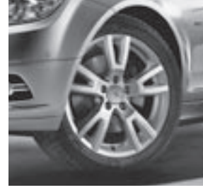
17" Naantali, 5-Doppelspeichen-Design