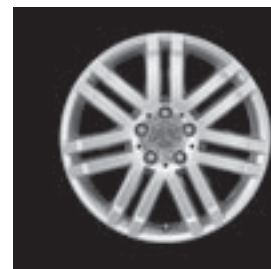
17" 7-Doppelspeichen-Design (R25)