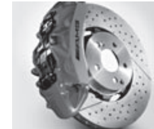
AMG Verbundbrems scheibe