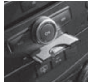
PCMCIA Multi-Card Reader