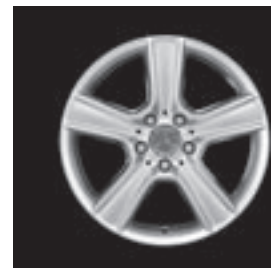
17" 5-Speichen-Design (R22)