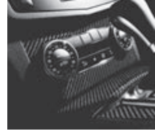
AMG Carbon Zierteile

* tagesaktuelle Konditionen unter www.mercedes-benz-bank.de (siehe Hinweis auf Seite 4)