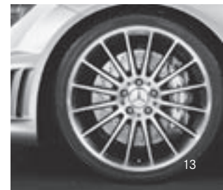
AMG 19" Vielspeichen-Design (788)