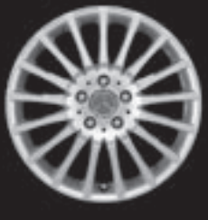
17" Vielspeichen-Design (R81)