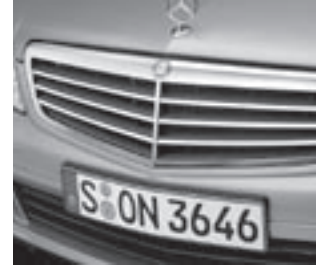
Lufteinlass, schwarze Lamellen

Zentralverriegelung mit Innenschalter und Crash-Sensor