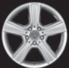
17" 5-Speichen-Design (R22)