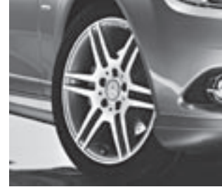
17" AMG 6-Doppelspeichen-Design