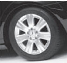
16" Pristix, 7-Speichen-Design