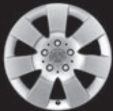
16" 7-Speichen-Design (R18)