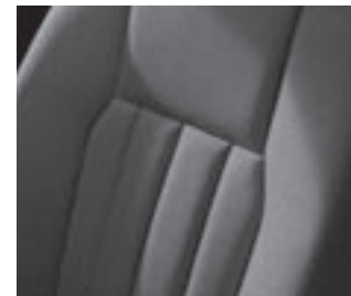
Polsterung Stoff »Edinburgh«