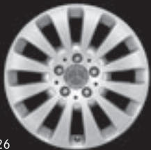
17" 12-Speichen-Design (1R8)