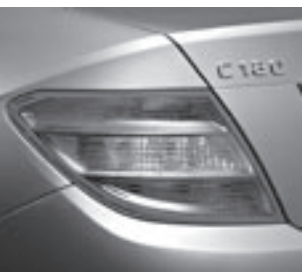
Schlussleuchte in Klarglas