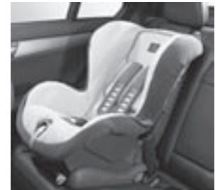
Kindersitz DUO plus