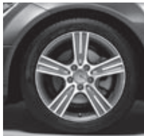
17" Redali, 5-Speichen-Design