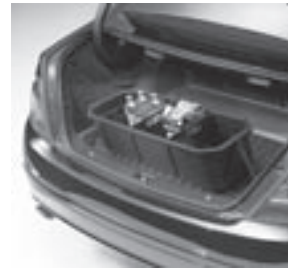
Kofferraumwanne, flach mit Staubbox