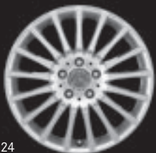
17" Vielspeichen-Design (R81)