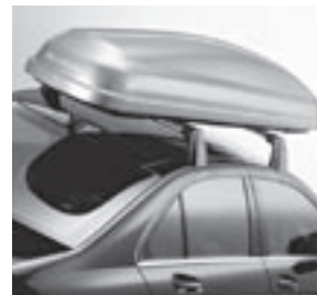
Grundträger New Alustyle, Mercedes-Benz Dachbox