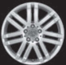
17" 7-Doppelspeichen-Design (R25)