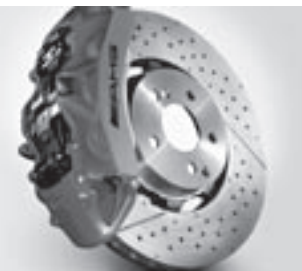
AMG Verbundbrems scheibe