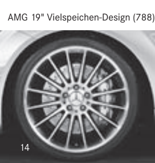
AMG 19" Vielspeichen-Design (788)