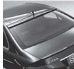
Dach- und Heckspoiler