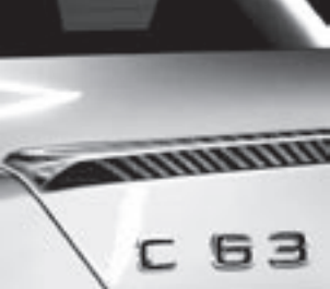
AMG Carbon Abrisskante