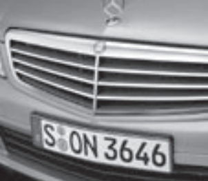
Lufteinlass, schwarze Lamellen