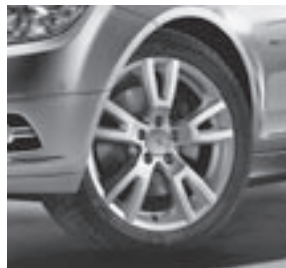
17" Naantali, 5-Doppelspeichen-Design