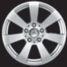
16" 7-Speichen-Design (R75/ 1R6)