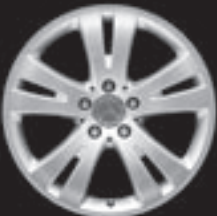
17" 5-Doppelspeichen-Design (1R7)