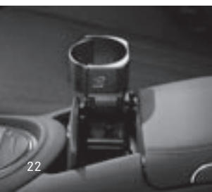
Cup- und Bottleholder