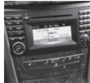
Audio 50 APS