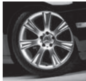
18" Menket, 7-Speichen-Design