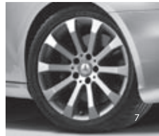
10-Speichen-Design (Code R43)