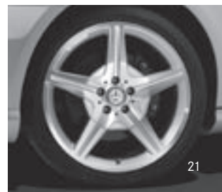
AMG 5-Speichen-Design (770)