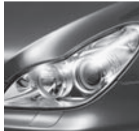
Bi-Xenon-Scheinwerfer mit aktivem Kurven-/Abbiegelicht