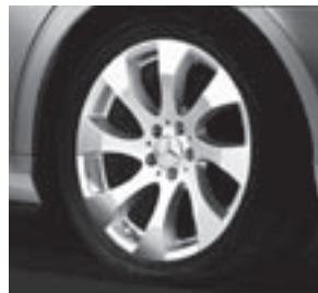
18" Anahita, 8-Speichen-Design