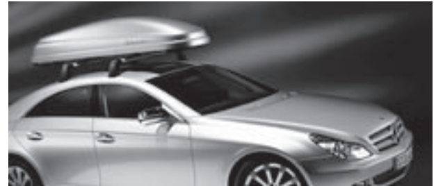
Grundträger New Alustyle, Mercedes-Benz Dachbox