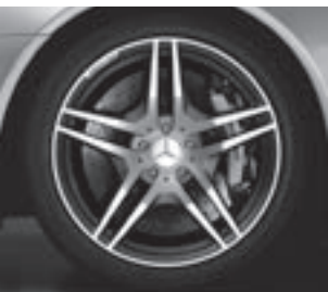
AMG 19" Schmiederäder (793)