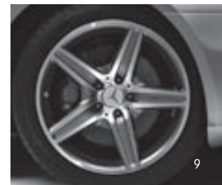
AMG 18" 5-Speichen-Design