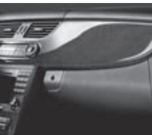
AMG Zierteile Carbon