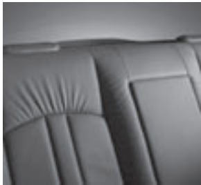
Komfortsitze Leder Nappa, Club-Design