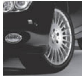
18" Vildiur, Vielspeichen-Design