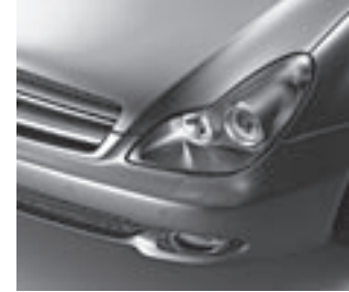
designo magno platin

Plakette Grand Edition seitlich an den vorderen Kotflügeln