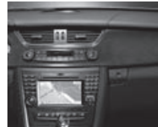
Zierteile Laurel matt