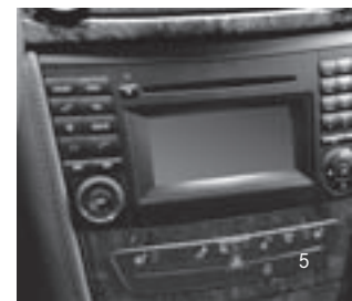
Radio Audio 20 CD