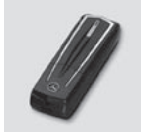
Telefon-Modul Bluetooth® SAP V3