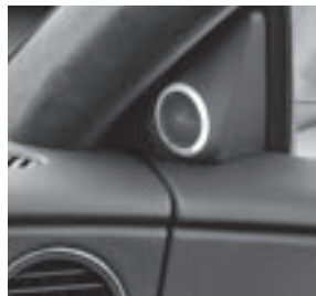
AMG High-End Surround-Soundsystem