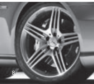
AMG Triplespeichen-Design (797)