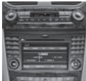
4-Zonen-Komfort-Klimatisierungs- automatik THERMOTRONIC