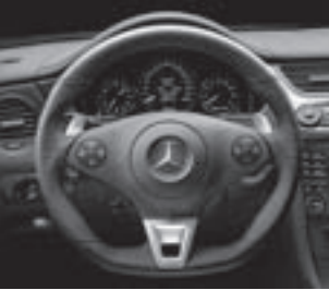
AMG Performance Lenkrad