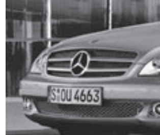
Kühlergrill mit 2 Lamellen

Zweiflutige Abgasanlage mit trapezförmigen Endrohrblenden in Edelstahl poliert