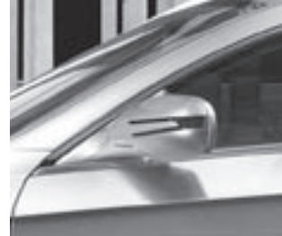
Blinkleuchte in Außenspiegel