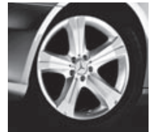
19" Zubenesli, 5-Speichen-Design