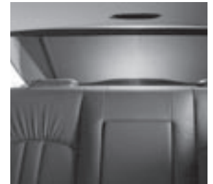
Rollo für Heckfenster